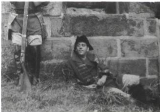
C'est pas la faute à Jacques Cartier

L.B. — Pour l'Expo 67, vous avez fait L'Homme Multiplié qui partage l'écran en plusieurs images. Comment avez-vous réalisé ce film ?