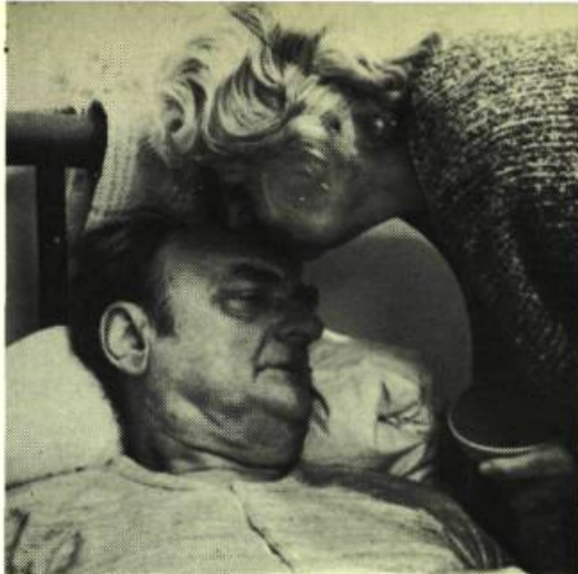
Les Dernières Fiançailles

Mon film ne ressemble pas aux films policiers américains, parce qu'aujourd'hui, au Québec, la forme d'espionnage dans les universités est "plate". Ça n'a rien de spectaculaire. L'agent double n'est pas armé.