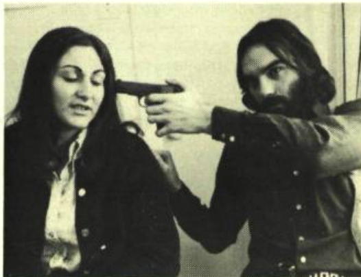
On n'engraisse pas les cochons à l'eau claire

Ultimatum est dédié à mes deux fils adoptifs. C'est très important, parce que ce sont des problèmes de jeunes. Je voudrais qu'ils se les posent.