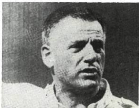
Un producteur indépendant, Stanley Kramer

La guerre de 1914 amena le triomphe universel des studios hollywoodiens; l'industrie en se développant fit bientôt éclater les cadres du control personnel. Les progrès de la technique, l'avènement du "Star System", la production de longs métrages, la diversification des tâches, tout cela faisait augmenter le coût de production des films.