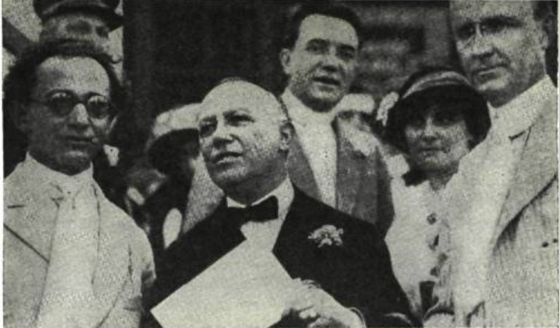
Carl Laemmle (au centre) préside l'inauguration des Studios Universal à Hollywood en 1915.

ver l'intégrité artistique de leur oeuvre, plusieurs réalisateurs à la réputation assurée sont devenus leurs propres producteurs (Prelinger, Hawks, Wyler, Wilder, Stevens). Des vedettes ont fait de même (Burt Lancaster, Kirk Douglas, Richard Widmark, John Wayne, Marlon Brando). Ainsi le commerce et l'art ont partie liée.