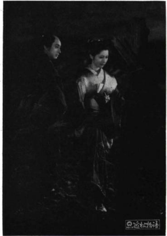
Rêve et réalité se fondent en une harmonie privilégiée — LES AMANTS CRUCIFIÉS, de Kenji Mizoguchi.

ralement au cinéma. Ni onirisme, ni expressionnisme. Une simple saignée dans le réel. C'est le pus qui gicle ou la source d'eau fraîche. En fait, c'est une coulée de détresse et d'espoir qui se confond avec le flux même de l'image. Il n'y a plus magie dans la fascination qu'exercent sur nous les images mais appréhension viscérale et spirituelle d'un tragique irrécusable : le cinéma éclaire dans toute sa profondeur la condition humaine.