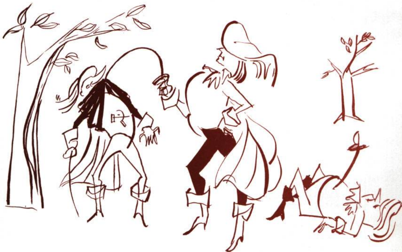
LE FILM DE CAPE ET D'ÉPÉE