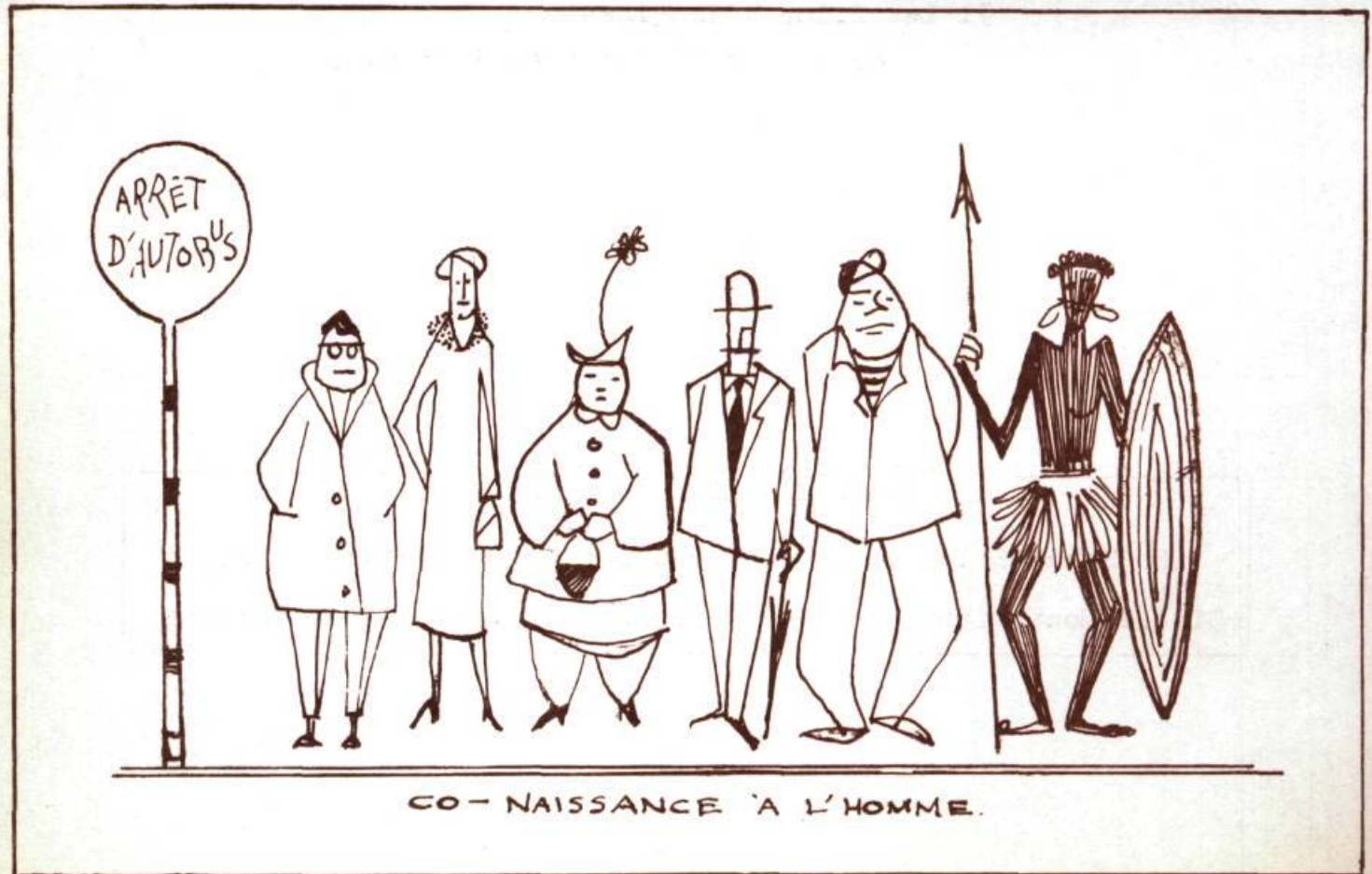
CO-NAISSANCE 'A L'HOMME.