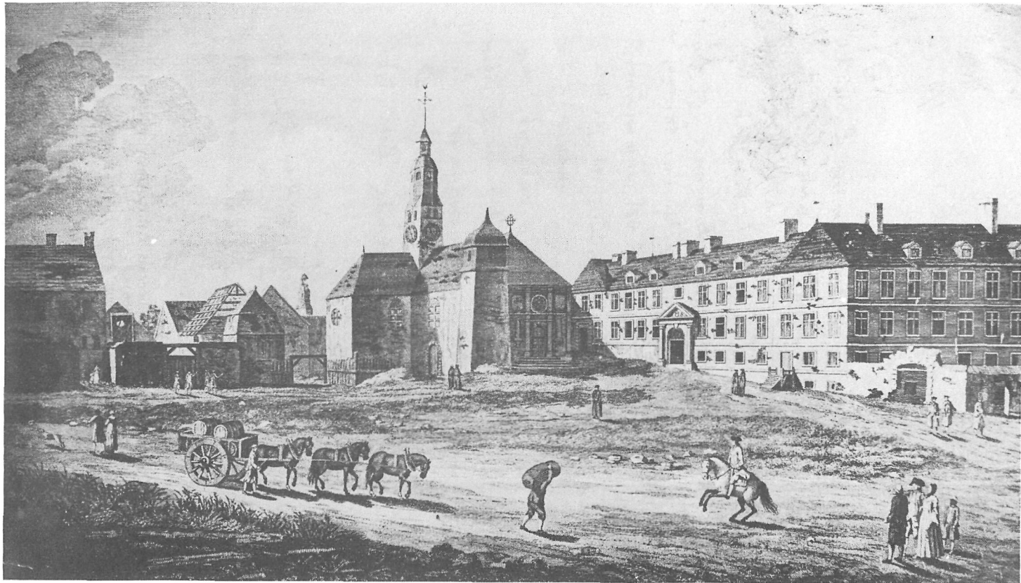
L'église et le collège des Jésuites, à Québec, en 1760 sur le site de l'hôtel de ville actuel La chapelle de la Congrégation des Messieurs, au premier étage du collège, se distingue par ses fenêtres ouvertes, à gauche de la porte d'entrée