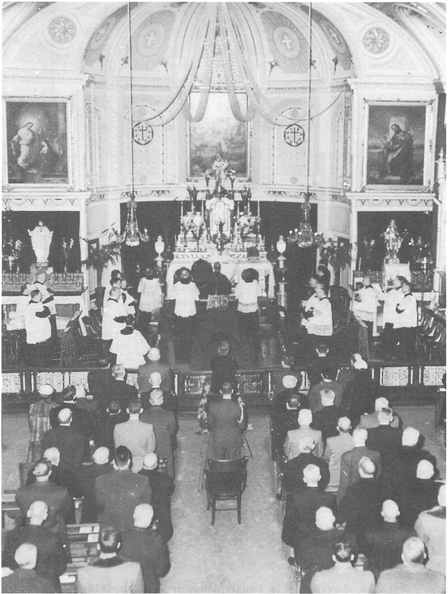
L'intérieur de la chapelle de la Congrégation jubilaire au matin du 3 février 1957 A l'autel, S.E. M gr l'Archevêque; au prie-Dieu, S.E. le Lieutenant-Gouverneur