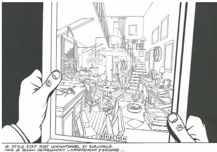
Fig. 4 - Mathieu, M.-A. (2001) Le Dessin (détail).