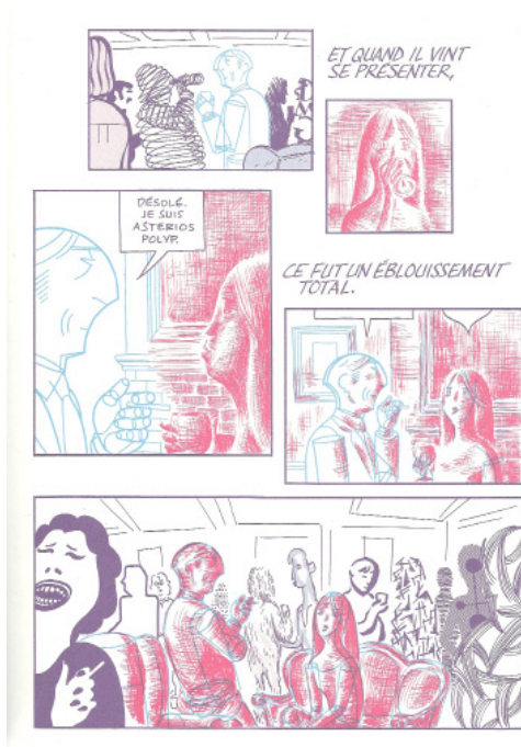
Fig. 1 - Mazzucchelli, D. (2010 [2009]). Asterios Polyp .

geste réflexif, n'empêche pas la nature polygraphique de l'œuvre d'être naturellement autodéictique, en tant qu'elle rend sensible son caractère artefactuel, autrement dit son statut d'objet matériel et construit, par la discontinuité stylistique et l'outrance de ses procédés. Chacun de ces réseaux réflexifs ne recoupe toutefois pas le jeu de la métalepse finale par laquelle le héros se débarrasse de feu son frère jumeau jusqu'alors narrateur d'outre-tombe : celui-ci n'aura plus l'occasion de gloser ironiquement la nature mixte du récit ("je ne vais pas vous faire un dessin"), puisque Asterios, prenant conscience de ce qu'il est "le héros de [s]a propre histoire", se confronte alors à son double, et que le lettrage narratorial s'invite dans des phylactères qui lui permettent de se battre d'égal à égal avec son double intradiégétique pour s'assimiler la biographie du personnage principal. Le jumeau narrateur avait sans doute prévu cette confrontation ("Asterios pourra vous le dire mieux que moi") qui le fait passer dans la diégèse puis disparaître. Mais cette scène, aussi onirique soit-elle, ne met pas seulement fin à la binarité existentielle du héros : elle trouve précisément à se réaliser par la seule qualité de la graphie, puisque ni le récitant évincé ni la figuration des sosies ne sauraient opérer, ensemble ou séparément, cette transgression.