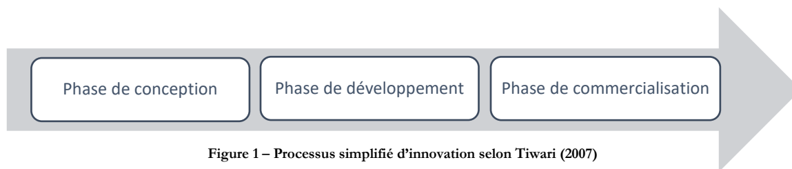
Figure 1 – Processus simplifié d'innovation selon Tiwari (2007)

Cette recherche vise à identifier et à comprendre les effets des parcs scientifiques sur les trois phases du processus simplifié d'innovation dans les entreprises, selon le modèle de Tiwari (2007) : conception, développement et commercialisation.