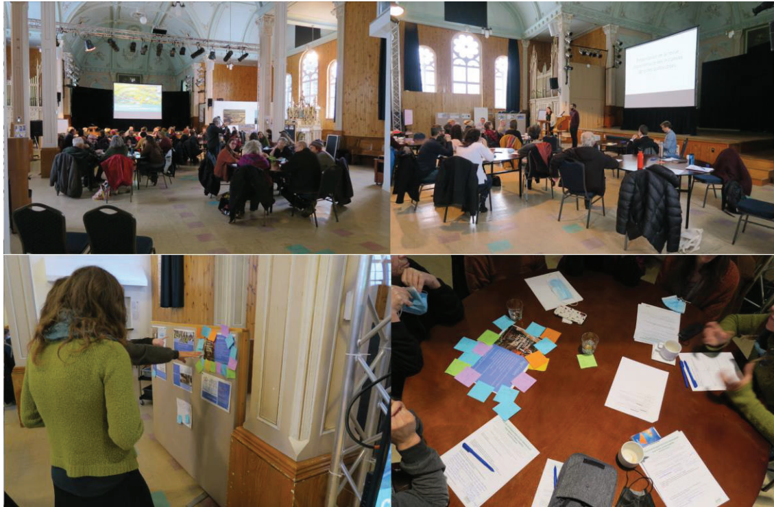
Figure 2 – Forum citoyen de Saint-Camille tenu le 27 novembre 2021

Ensuite, les initiatives ayant suscité le plus d'intérêt ont été examinées afin de déterminer s'il s'avérait pertinent de les documenter. Si cela a été le cas pour plus de la moitié, pour d'autres, cela apparaissait moins intéressant. Par exemple, les réfrigérateurs communautaires, où les gens sont invités à déposer leurs surplus alimentaires pour que des personnes dans le besoin puissent les récupérer, ont intéressé les personnes de Saint-Camille. Toutefois, bien qu'une telle initiative puisse revêtir certains enjeux, notamment d'emplacements possibles et souhaitables, ceux-ci ne sont pas apparus suffisamment complexes pour justifier leur documentation. Par ailleurs, les responsables d'une autre initiative n'ont pas pu être joints, malgré de nombreuses tentatives. Enfin, il est apparu qu'une initiative n'était finalement plus active. À la suite de cette séance de coconstruction, d'autres initiatives à documenter ont été identifiées par l'équipe de recherche, par la CODESESCA et par les personnes de Saint-Camille participant aux rencontres des ASP.