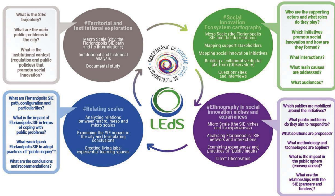
Figure 2 – Cadre analytique et méthodologique

Compte tenu de ces aspects préliminaires, le cadre analytique et méthodologique adopté dans le projet a été structuré en quatre moments principaux, qui n'ont pas été développés de manière linéaire. Ces quatre moments sont résumés à la figure 2, puis décrits ci-dessous.