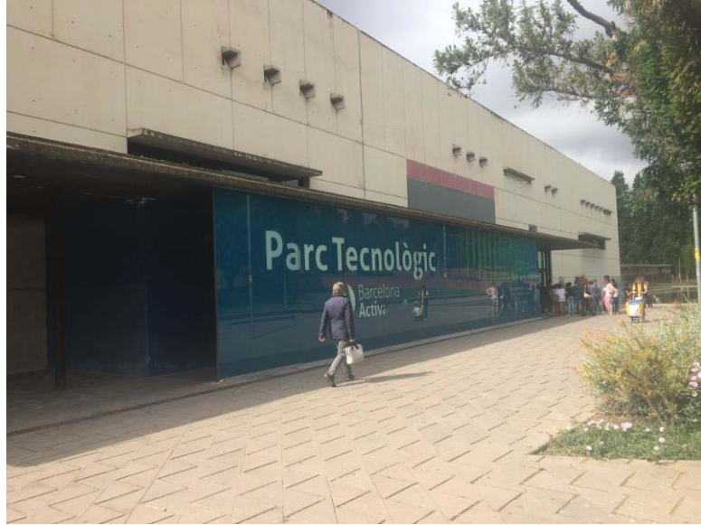
Photo 5 – L'emploi à Ciutat Meridiana