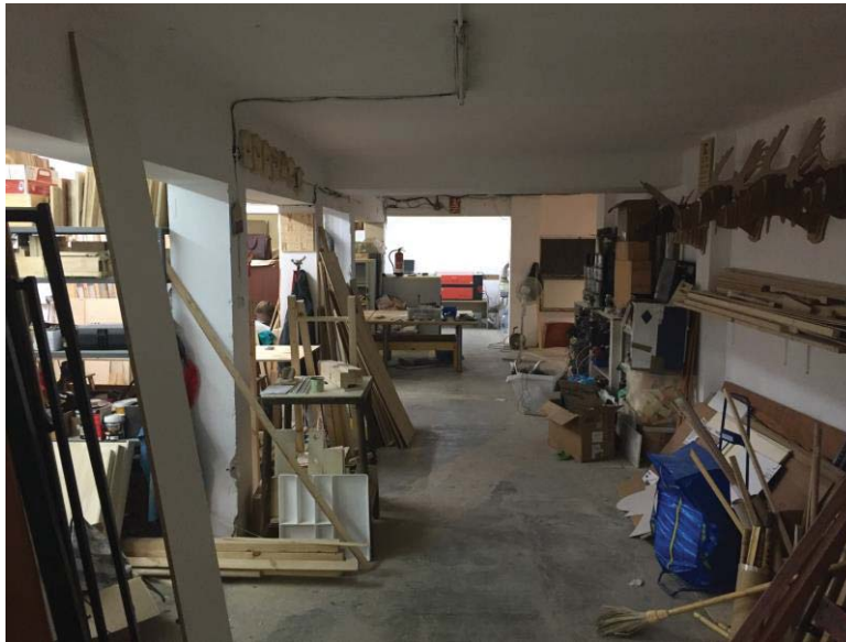
Photo 1 – Made Makerspace à Barcelone

Nommés en anglais small-scale manufacturing spaces , ces ateliers désignent les espaces de grande superficie qui regroupent des autoentrepreneurs ou de petites entreprises intéressées par la production de biens matériels nécessitant des outils et des machines industrielles (voir photo 3). Ces ateliers offrent également des bureaux, des formations et des services d'incubation et d'accompagnement pour le prototypage et la production à petite échelle. L'accès est payant et le public visé est composé de professionnels dans le domaine manufacturier.