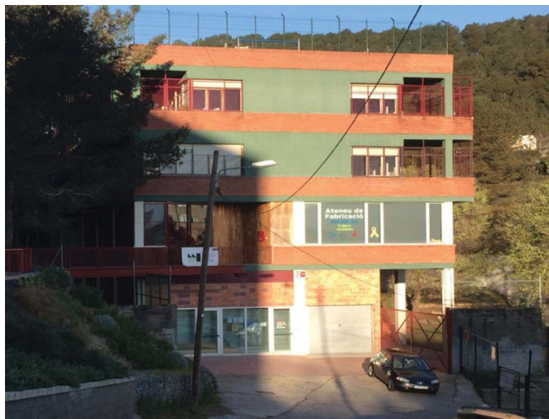
Photo 7 – L'entrepreneuriat à Nou Barris Source : Diaz et Lefebvre, 2019