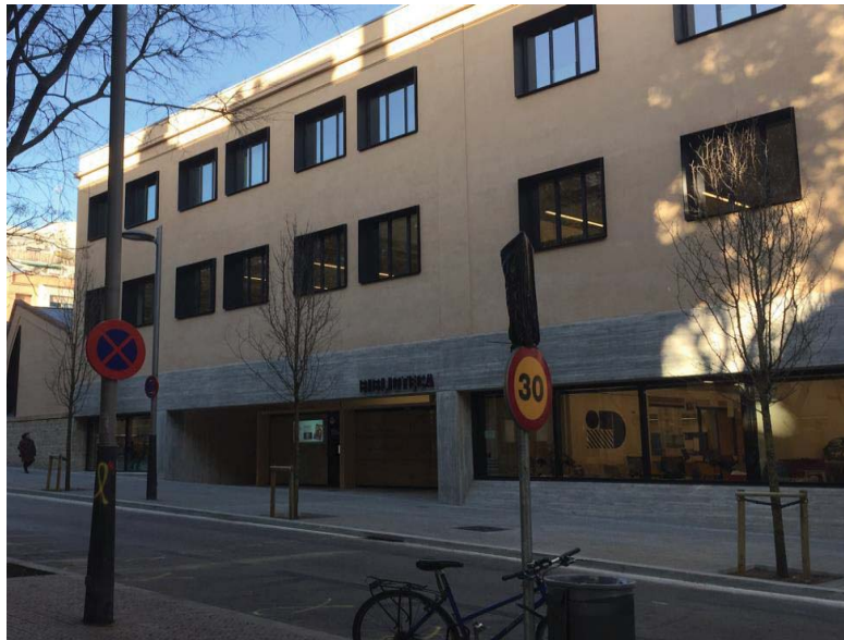
Photo 6 – L'inclusion sociale à Les Corts