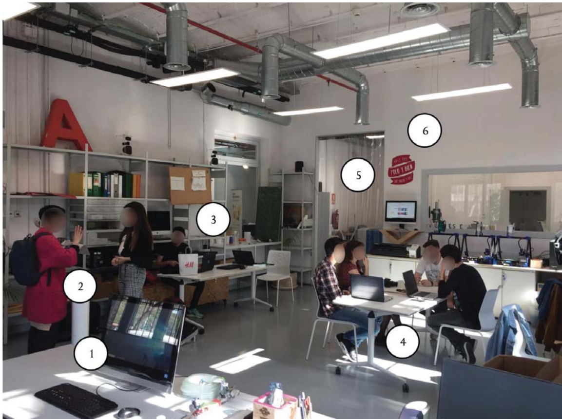
Photo 8 – Parcours de l'utilisateur au sein de l'atelier de fabricació de Barceloneta tel qu'il a été pensé par les dirigeants du réseau des ateneus de fabricació