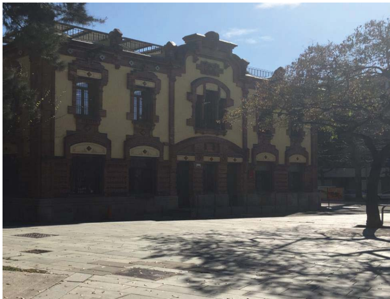
Photo 4 – L'environnement à Barceloneta

4) Chaque ateneu possède une spécificité territoriale en lien avec la nature de l'organisation gérante et les politiques locales du quartier ( barri ) dans lequel il se trouve : l'environnement à Barceloneta (voir photo 4), l'emploi à Ciutat Meridiana (voir photo 5), l'inclusion sociale à Les Corts (voir photo 6) et l'entrepreneuriat à Nou Barris (voir photo 7). Cette différenciation thématique vise à favoriser un ancrage territorial avec les acteurs présents sur le territoire en leur donnant la possibilité d'explorer et de prototyper des projets collectifs répondant à des besoins locaux.