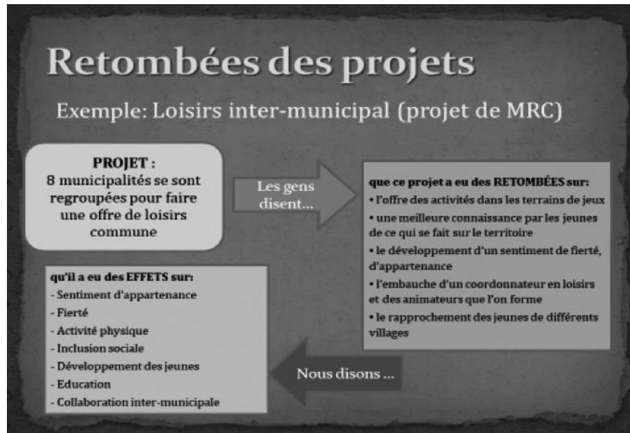
Figure 3 – Exemple : Le loisir intermunicipal (projet de MRC)