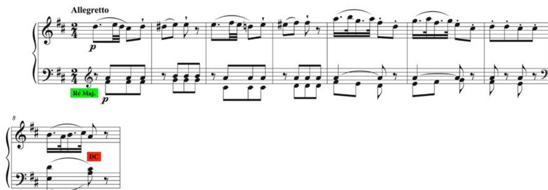
Figure 19 : W. A. Mozart, Sonate K. 576/III, mes. 1-8. Écouter l'extrait.

Les cas sont si nombreux qu'on peine à en choisir un. Un premier type de situation émerge : celle d'un rondo à peu près monothématique, où tout provient du refrain, en dehors du matériau idiomatique et athématique qui surgit la plupart du temps dans les couplets. Le Rondo K. 485 est dans ce cas, ainsi que le troisième mouvement de la Sonate K. 576. Prenons ce dernier cas, dont la première phrase du Refrain 1 était celle rapportée par la figure 19.