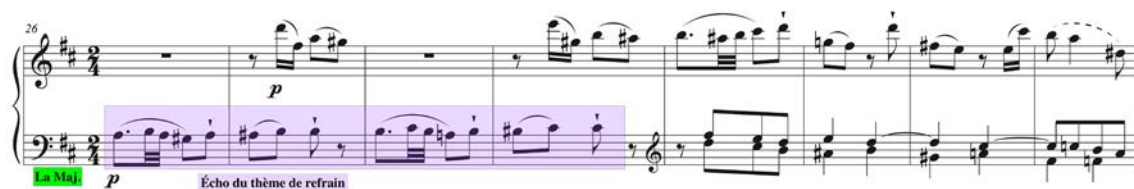
Figure 20 : W. A. Mozart, Sonate K. 576/III, mes. 26-33. Écouter l'extrait.

Dans les couplets, ce ne sont qu'échos de ce thème, à commencer par le début du premier couplet (figure 20).