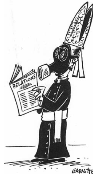
Garbotté, paru dans Nouvelles CSN . Encre de Chine sur bristol

Je suis d'accord sur le fait que cette dimension a souvent été laissée de côté. Nous reviendrons sûrement sur les raisons de cet «oubli». Mais c'est précisément dans la réappropriation de cette part oubliée, au moyen