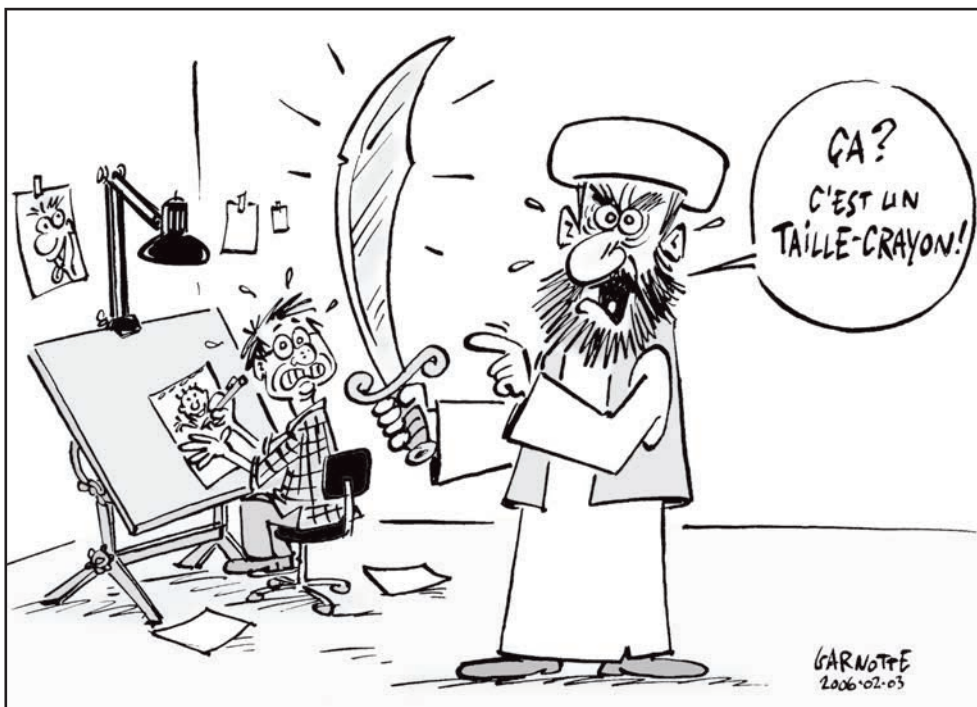
Garnotte, paru dans Le Devoir , 2006. Encre de Chine sur bristol, mise en couleur numérique

d'un travail herméneutique sur les sources et les textes fondateurs, que les religions peuvent prétendre à une libération.