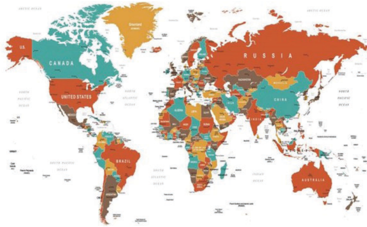
Carte du monde européocentrée

Des phénomènes similaires s'observent dans la connaissance et la pratique du travail social.