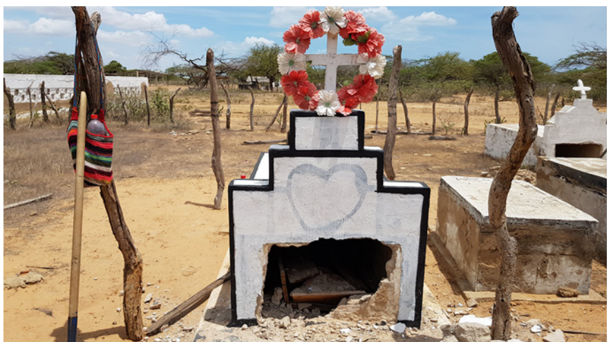
Figure 4 : Tombe ouverte pour exhumation, cimetière de Panachü, localité de Manaure (Photo Lionel Simon, juin 2019)