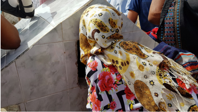
Figure 5 : Pose de restes mortuaires dans un ossuaire, Haute Guajira (Photo Lionel Simon, juin 2019)

C'est sur la base de ces deux aspects notables – existence de « nécropoles » et pratique des doubles funérailles – que je propose de saisir la spécificité des traitements que les Wayüu réservent à leurs morts, et plus particulièrement de la manière dont ils actualisent l'articulation entre rupture et continuité. Nous commencerons par nous pencher sur le parcours des individus dans le monde, à travers les grandes lignes de la thanatologie wayüu, pour ensuite prendre acte de la « territorialisation » des morts. Cela permettra d'inscrire les pratiques funéraires dans un complexe plus large de relations et de prendre acte des propriétés ontologiques attribuées aux esprits de défunts. Nous traiterons enfin de la place que joue l'oubli dans ce contexte ethnographique, de façon à décrire une position intermédiaire entre rupture et continuité, qui oscille entre l'abolition et la conservation des morts et qui se répercute dans une posture attentive à l'allégresse de ces derniers. Commençons donc par placer les gestes mortuaires dans les compréhensions locales du trépas comme processus.