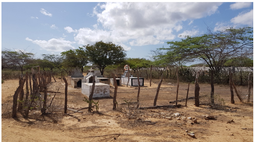
Figure 2 et 3 : Cimetière de Panachü, localité de Manaure (Photos Lionel Simon, juin 2019)