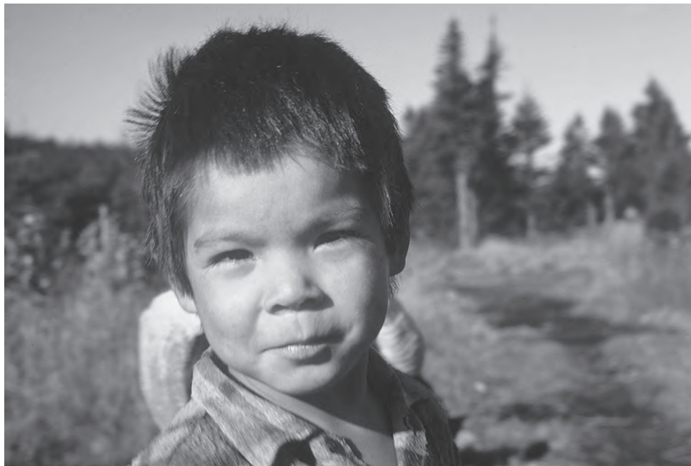
Un enfant d'Unaman-shipit, automne 1970