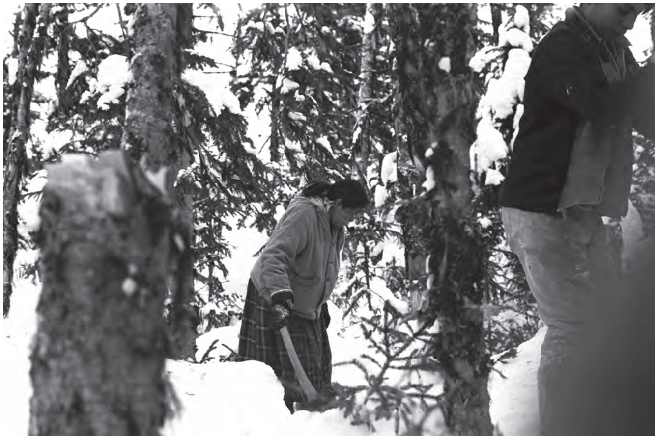
Une femme cherchant du bois de chauffage, hiver 1971