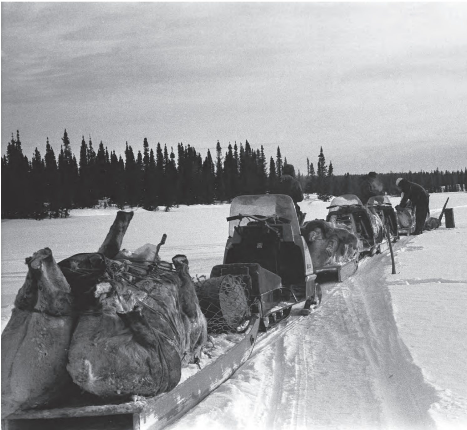
Chasse au caribou, hiver 1971