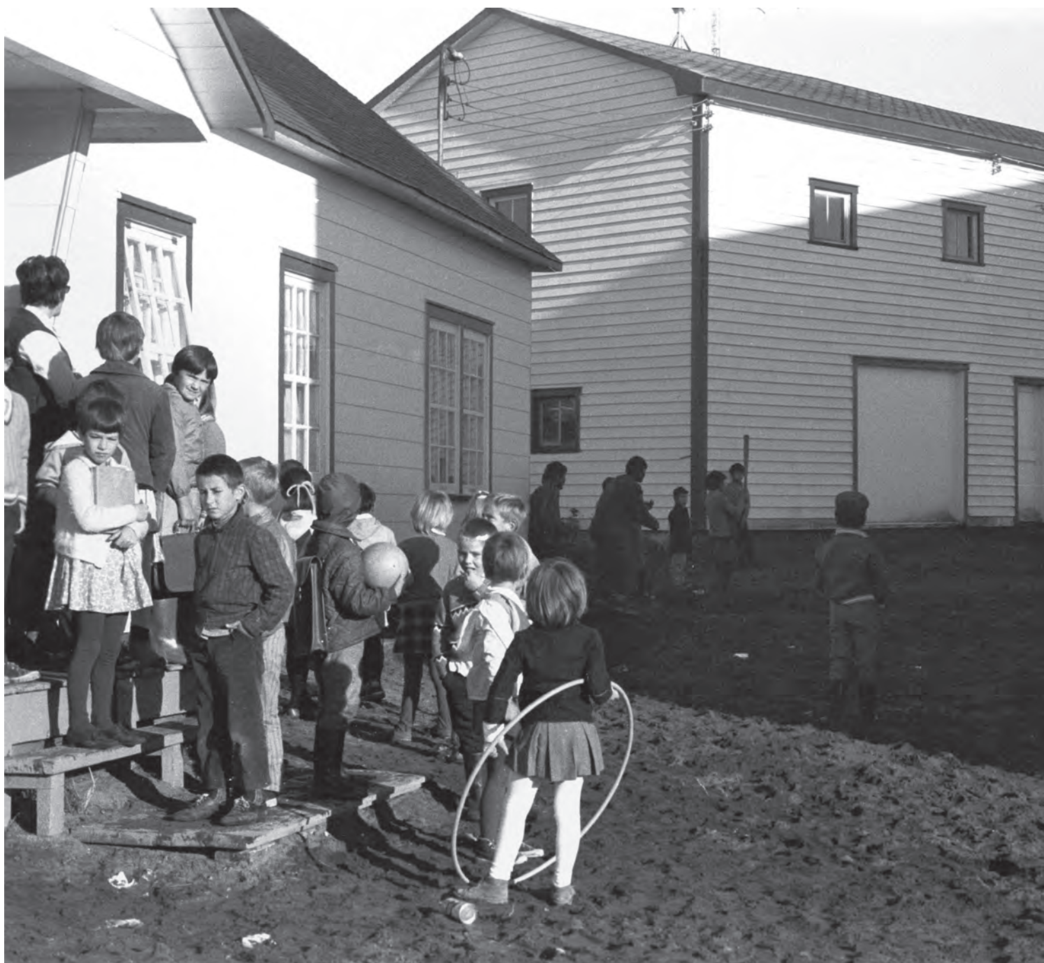
L'école (au village des Blancs), Saint-Augustin, automne 1970