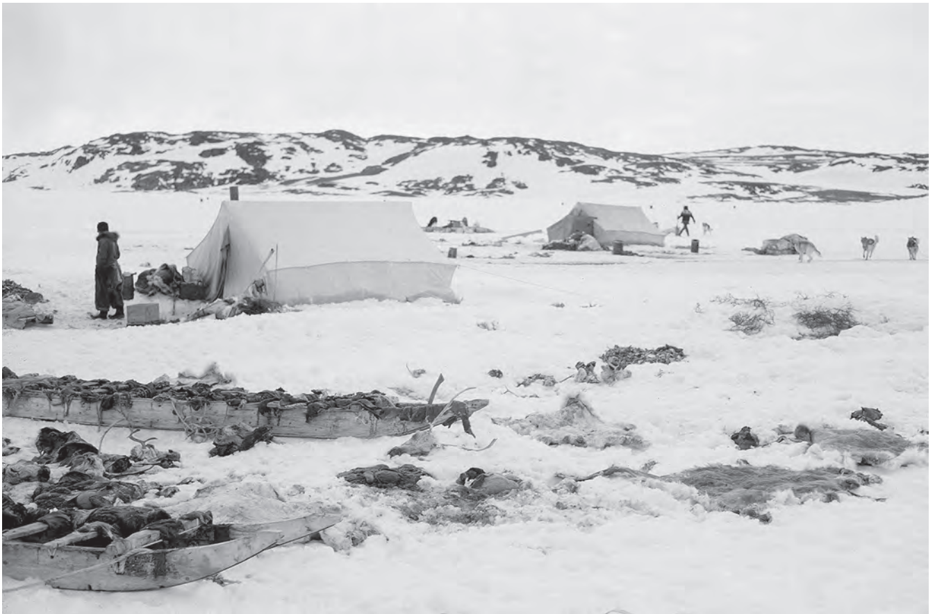
Retour de la chasse au caribou