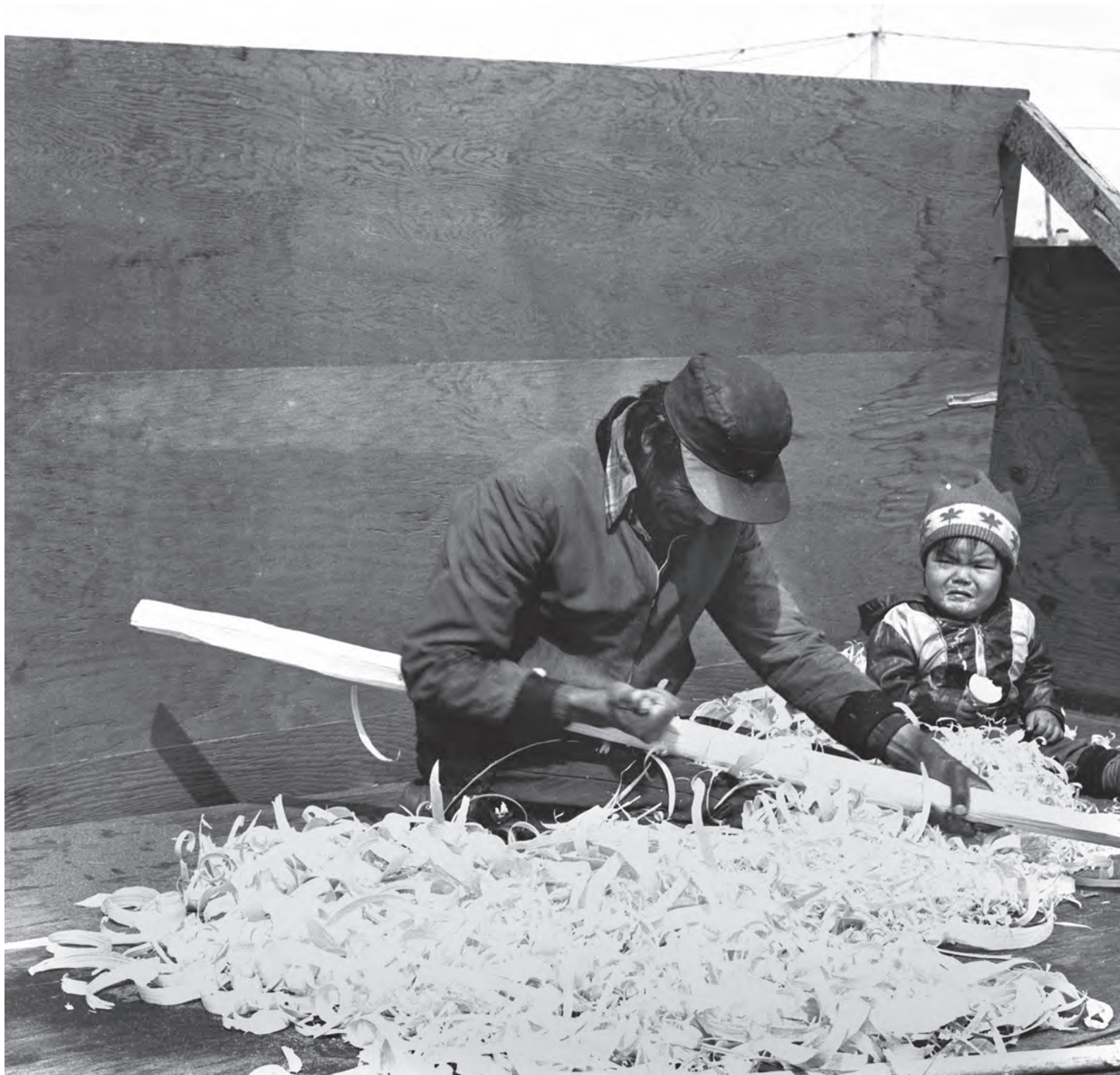
Fabrication d'une rame à l'aide d'un couteau croche

(PHOTOS : RÉMI SAVARD; RESTAURATION : FRANÇOIS LÉGER-SAVARD)