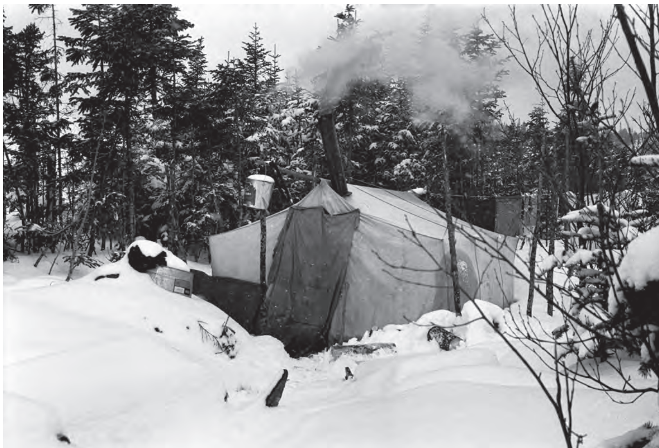
L'une des seize maisons du village, hiver 1971