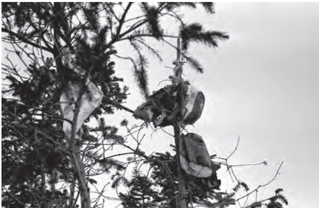
Restes d'un animal terrestre accrochés en offrande dans un arbre, hiver 1971