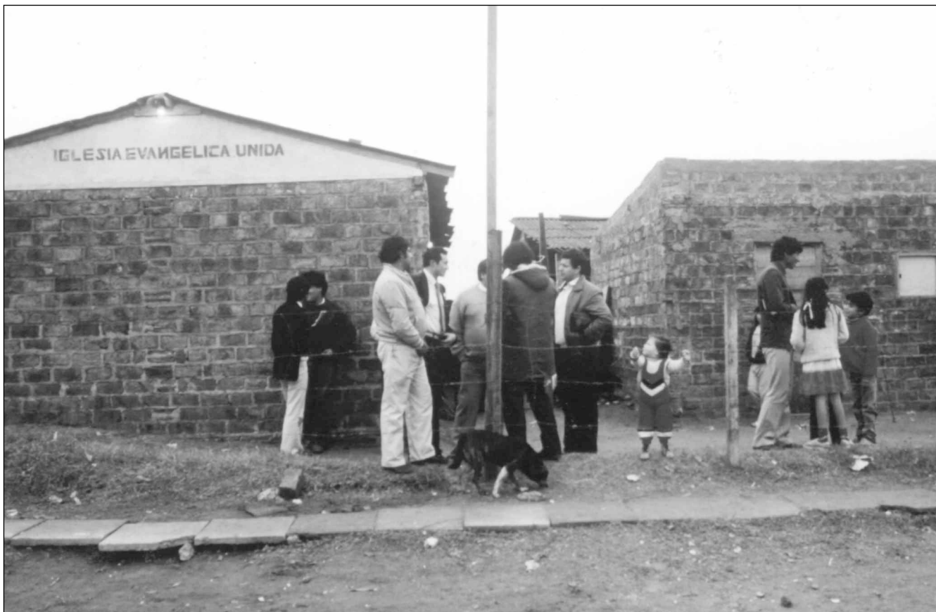
Le temple de L'Ingesia Evangélica Unida de Villa Iapi (Photo Liliana Tamagno, 1998)

ma recherche, le thème s'est imposé graduellement à travers l'observation et l'analyse d'une série de situations qui ont fait que ce phénomène en est venu à constituer un des axes centraux de ma recherche. J'estime en effet que, sans l'étude de ce phénomène, on ne peut pas comprendre la dynamique sociale, culturelle et politique du peuple toba.