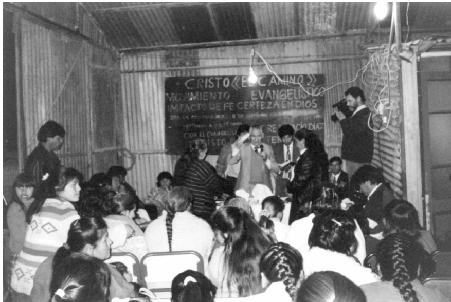
Photo 3 : La sainte Cène : la bénédiction du pain (Photo Liliana Tamagno, 1998)

La commémoration des anniversaires de l'Église unie Temple de la foi » constitue également un moment très particulier. Les préparatifs commencent quelques jours à l'avance. Aux environ de 9 h débute la réception des invités parmi lesquels, à côté des gens de Villa Iapi ainsi que des membres de l' Iglesia Evangélica Unida fondée à quelques coins de rue de là, à cause des disputes de leadership auxquelles nous avons fait allusion précédemment. La présence de « Blancs » ( blancos ), « Frères d'autres Églises », souligne les liens avec ces Églises ou avec d'autres dénominations pentecôtistes. Le matin, la présence des invités, généralement des Blancs, peut même surpasser en nombre celle des autochtones, bien que la réception des visiteurs et le culte soient toujours pris en charge par le pasteur toba et ses collaborateurs. Tous les membres de l'Association civile toba Ntaunaq Qom, qui regroupe les familles ayant bâti elles-mêmes leurs habitations de cette banlieue de La Plata, même ceux qui n'assistent pas souvent au culte, collaborent à l'organisation de cet événement. Ils organisent l'espace de sorte qu'on puisse y servir le repas qu'on offre aux invités et réaliser le culte. En après-midi, les visiteurs