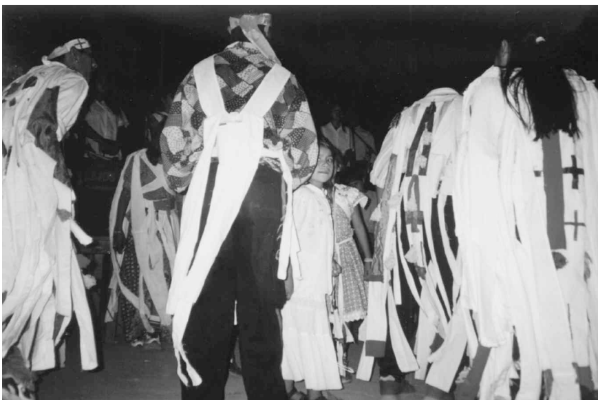
Rencontre annuelle des jeunes : le groupe de danse

bouillantes. Dans le quartier toba de Resistencia, une des femmes en charge de la cuisine disait, pendant une pause : « Nous sommes habituées [...], nous avons toujours reçu les Frères qui viennent de loin. Si nous sommes fatiguées? Oui... mais [...] c'est beau de le faire et c'est beau de voir les résultats. »