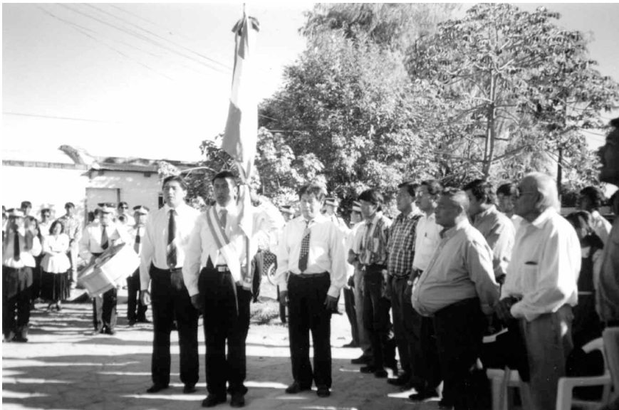
Inauguration de la rencontre annuelle des jeunes (Photo Liliانا Tamagno, 1998)