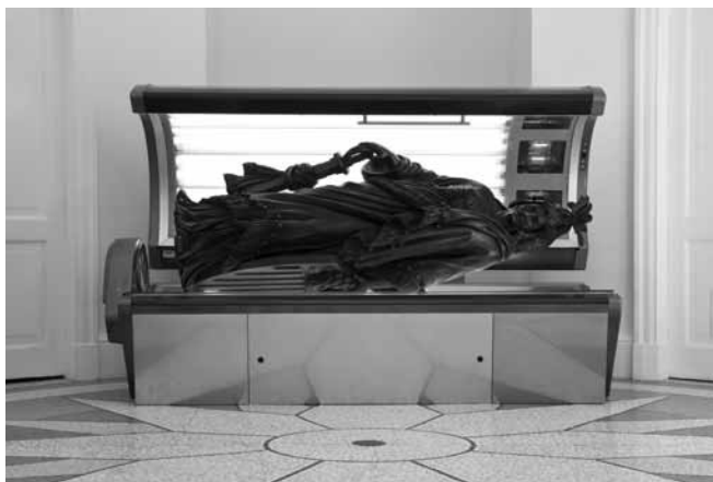
Figure 1. Allora & Calzadilla, Armed Freedom Lying on a Sunbed , 2011, sculpture et banc solaire, installation présentée au Pavillon des États-Unis lors de la 54 e Biennale de Venise, 165 x 256 x 134 cm.

en fait un des principaux symptômes de la « fin de l'art », cette nouvelle époque de l'art qui aurait connu ses premiers balbutiements avec la peinture de genre au XVII e siècle et aurait atteint son plein épanouissement avec les romans humoristiques de son contemporain... Jean Paul, justement. L'humour, comme fluidification des contraires, s'inscrira désormais au cœur du régime esthétique de l'art. D'entrée de jeu, il se chargera d'une dimension critique qui sera sans cesse actualisée par les artistes du régime esthétique de l'art, y compris les artistes d'avant-garde, au premier rang desquels les dadaïstes qui en feront grand usage au début du XX e siècle.