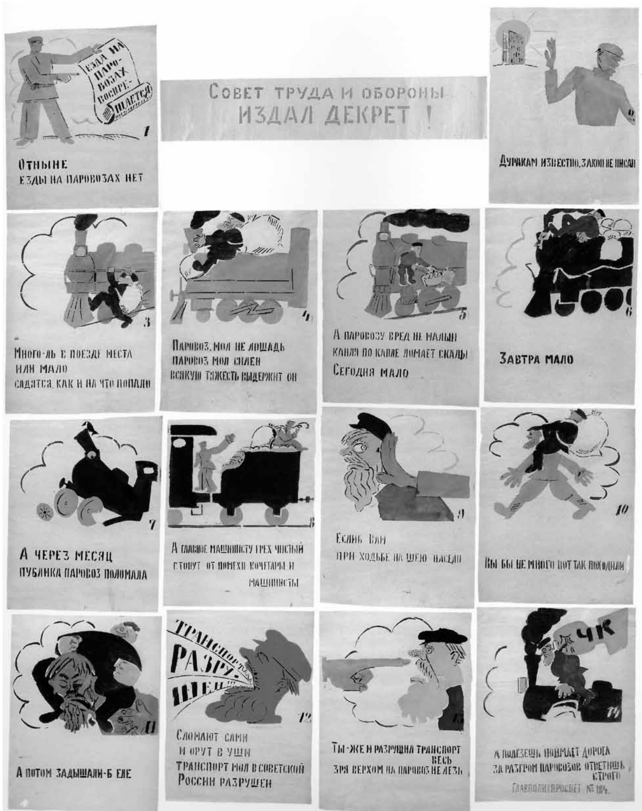
Figure 4. Vladimir Maiakovski, À partir d'aujourd'hui, on ne s'accroche plus aux locomotives , mai 1921, 47 x 37 cm, Jérusalem, Le musée d'Israël (crédit photographique : Le musée d'Israël. Toute reproduction est interdite sans autorisation).