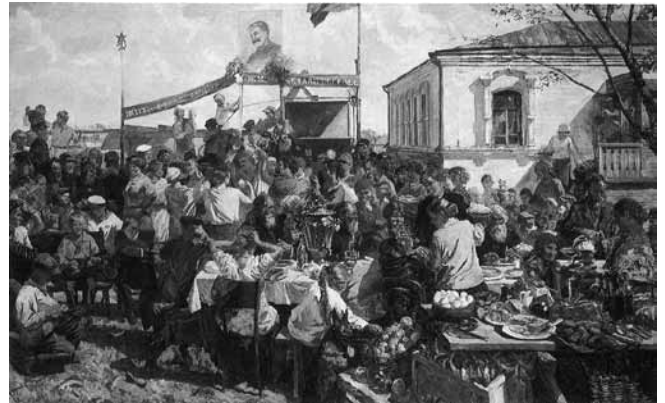
Figure 7. Arkadi Plastov, La Fête au kolkhoz , 1937, 188 x 307 cm, Saint-Petersbourg, Musée d'État russe.

En effet, à la fin des années 1920, coïncidant avec le début du premier plan quinquennal 46 et de la révolution culturelle, Staline et ses disciples lancent le mot d'ordre selon lequel le socialisme a été atteint en URSS, que « La vie est devenue meilleure, la vie est devenue plus joyeuse », comme l'indique le slogan qui pare la bannière du très célèbre tableau réaliste socialiste d'Arkadi Plastov, La Fête au kolkhoz , peint en 1937 (fig. 7). Dans les pages de la Literaturnaya gazeta , les opposants à la satire argumentent que dans ce nouveau contexte, où la victoire du socialisme est achevée, où l'ennemi a été impitoyablement vaincu, la critique et la satire n'ont plus leur utilité. Abondant dans ce sens, le journaliste Vladimir Blum affirme que la satire étant un outil privilégié de la lutte des classes, dans un monde où le prolétariat a triomphé, « La notion de "satire soviétique" est une contradiction en soi. Elle est aussi absurde que les notions de "banquier soviétique" et de "propriétaire soviétique" » 47 .