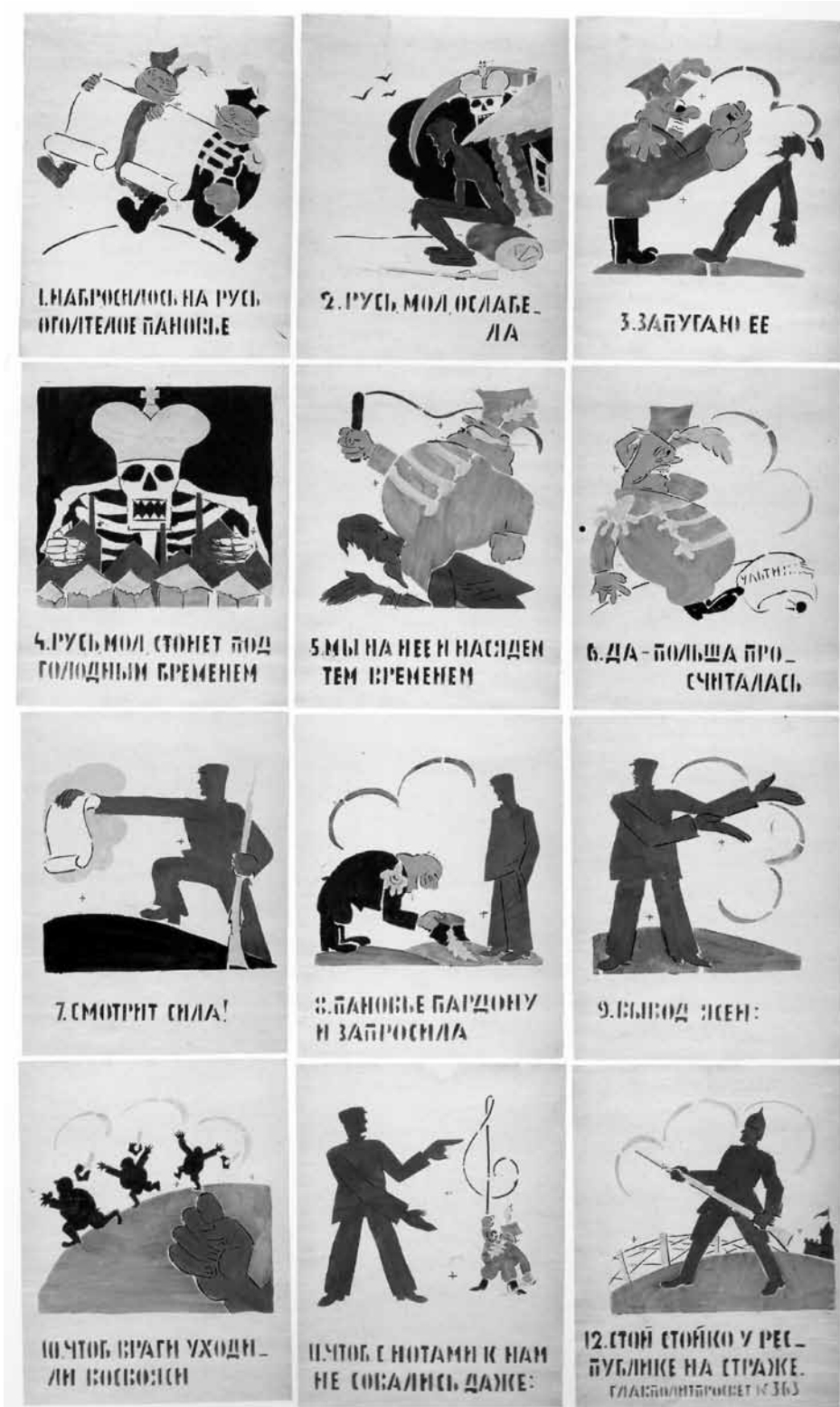
Figure 1. Vladimir Maïakovski, L'aristocratie polonaise se jette sur la Russie , fin septembre ou début octobre 1921, 53 x 42 cm, Jérusalem, Le musée d'Israël (crédit photographique : Le musée d'Israël. Toute reproduction est interdite sans autorisation).