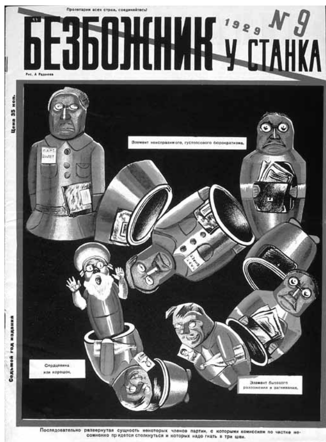
Figure 5. Aleksandr Radakov, La bureaucratie qui s'autogénère, la corruption et la décadence du Parti , couverture de la revue Bezbozhnik u stanka , no 9, 1929, 35 x 25,75 cm, Londres, La collection David King.

cadre de nombreuses campagnes subventionnées par l'État, entre autres les campagnes contre la religion, contre l'alcoolisme, contre la prostitution et celles visant la bureaucratisation excessive ou la corruption au sein même du Parti, pour ne nommer que celles-là. Ces campagnes, qui privilégient le mode satirique dans leur propagande, partagent un trait commun : elles visent toutes des problèmes sociaux actuels, considérés comme un legs pernicieux du monde prérévolutionnaire. Le rire sert donc, dans ce contexte, à jeter un éclairage moqueur sur une déviation de la norme idéologique bolchévique ou sur « une imperfection collective qui appelle la correction immédiate », pour reprendre l'expression de Bergson citée plus haut. Comme l'explique Lounatcharski, « Je crois que les "scorpions" de la satire peuvent être dirigés contre le philistinisme, l'étroitesse d'esprit et le bureaucratisme, qui, comme une poussière dans l'air, viennent troubler la respiration saine d'un organisme vigoureux » 43 .