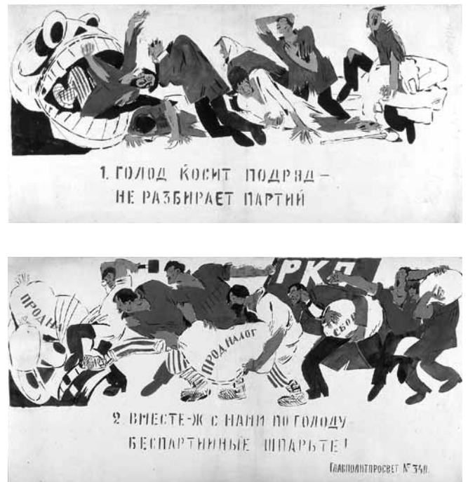
Figure 2. Mikhaïl Cherevnykh, La famine tue sans discrimination politique; Sans-parti, unissez-vous au Parti pour la vaincre , septembre 1921, 53 x 108 cm, Jérusalem, Le musée d'Israël (crédit photographique : Le musée d'Israël. Toute reproduction est interdite sans autorisation).

Dans les fenêtres RosTA , un éventail de figures caricaturales, facilement interprétables par les masses illettrées en raison de leurs attributs exagérés, sont employées librement pour dépeindre les ennemis du régime sous des traits désagréables et ridicules; on reconnaît les généraux étrangers affublés d'énormes médailles, le sang dégoulinant de leurs mains meurtrières; les capitalistes bedonnants dans leurs complets noirs, traînant derrière eux d'énormes poches d'argent; ou encore les prêtres, le nez rougeaud et gonflé d'alcool, dérobant aux paysans leurs victuailles. Il s'agit en fait de tipazh , une pratique encouragée dans les milieux de la propagande soviétique, qui vise à mettre en lumière par des stratégies caricaturales certaines caractéristiques d'une catégorie sociale. Comme le note Victoria Bonnell, « The essence of tipazh was not typicality but, rather, typecasting or typicalisation » 39 . Dans sa discussion du tipazh , Lounatcharski insiste d'ailleurs sur la nécessité de transformer et d'exagérer cer-