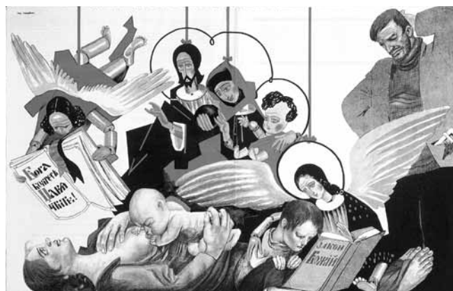
Figure 6. Mikhail Cheremnykh, Ma pauvre, ils ont empoisonné ton âme , double page centrale de la revue Bezbozhnik u stanka , no 6, 1923, 36 x 54 cm, Londres, La collection David King.

cadre de nombreuses campagnes subventionnées par l'État, entre autres les campagnes contre la religion, contre l'alcoolisme, contre la prostitution et celles visant la bureaucratisation excessive ou la corruption au sein même du Parti, pour ne nommer que celles-là. Ces campagnes, qui privilégient le mode satirique dans leur propagande, partagent un trait commun : elles visent toutes des problèmes sociaux actuels, considérés comme un legs pernicieux du monde prérévolutionnaire. Le rire sert donc, dans ce contexte, à jeter un éclairage moqueur sur une déviation de la norme idéologique bolchévique ou sur « une imperfection collective qui appelle la correction immédiate », pour reprendre l'expression de Bergson citée plus haut. Comme l'explique Lounatcharski, « Je crois que les "scorpions" de la satire peuvent être dirigés contre le philistinisme, l'étroitesse d'esprit et le bureaucratisme, qui, comme une poussière dans l'air, viennent troubler la respiration saine d'un organisme vigoureux » 43 .