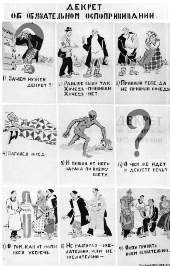
Figure 3. Auteur inconnu, Que ça te plaise ou non; Se faire vacciner contre la variole, c'est ton obligation , fin juillet ou début août 1921, 52 x 37 cm, Jérusalem, Le musée d'Israël (crédit photographique : Le musée d'Israël. Toute reproduction est interdite sans autorisation).

tains traits : « L'artiste ne doit pas se satisfaire de ce qui est, il doit aller plus loin, afin de dévoiler des tendances qui ne se sont pas encore révélées » 40 .