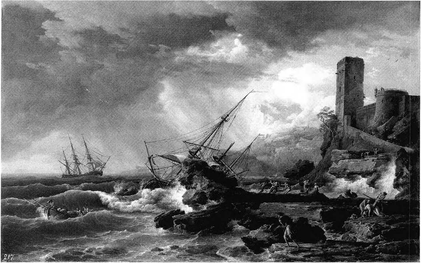
Figure 1. Claude-Joseph Vernet, Naufrage , 1754, huile sur toile, 85.8 × 135.9 cm, Londres, The Wallace Collection (crédit photographique: The Wallace Collection).

Burke parle de la vraie mer dans son traité alors que le philosophe français, lui, s'émeut devant son interprétation artistique. Cette distinction est essentielle puisqu'elle repose sur une conception différente de l'art. Comme l'écrit Bukdahl : « Diderot ne peut accepter l'affirmation de Burke selon laquelle les événements de la vie réelle exercent toujours une influence plus profonde que l'interprétation artistique qui en est donnée. » 17 Réfléchissant sur cet aspect de la pensée esthétique de Diderot, Herbert Dieckmann conclut que si « Diderot a hérité de la doctrine classique le principe de l'imitation de la nature » 18 , il lui a accordé de multiples significations suivant une évolution que l'historien présente comme allant de l'imitation à l'expression. En fait, Diderot avait bel et bien adopté le sublime de Burke, mais en l'intégrant à une pensée qui accordait à l'art une plus grande autonomie parce qu'elle ne reconnaissait pas la supériorité classique du modèle sur l'image.