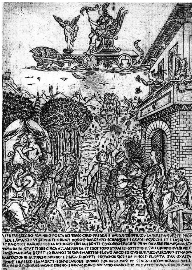
Figure 1. Atelier de Baccio Baldini ?, Vénus et ses Enfants , gravure florentine sur cuivre, 1464-65, Londres, British Museum (Photo : British Museum, Londres).

forcément plus beau, plus musicien et plus séduisant, c'est-à-dire plus vénusien. Dame Porzia remarque la beauté corporelle du jeune artiste dans un discours qui fait écho au Courtisan de Castiglione : pour elle l'apparence physique du jeune homme témoigne de sa haute vertu, et un peu plus tard elle voudrait pouvoir le récompenser d'un château 17 . Le décor de leurs entretiens est la Farnésine, et, lorsque la dame le remarque pour la première fois, il est en train de dessiner la figure de Jupiter, tirée de fresques de Raphaël représentant les amours des dieux. Pour lui montrer de quelle façon il compte refaire son bijou, il exécute un dessin rapide, qui fait dire à Porzia qu'il dessine trop bien pour un orfèvre 18 . C'est la seule scène des 520 folios de la Vita dans laquelle Cellini se met en scène comme copiste de Raphaël. Et malgré l'accent mis ici sur le dessin, le jeune et galant Benvenuto n'en fabrique pas moins pour elle un petit modèle en cire avant de commencer son ouvrage.