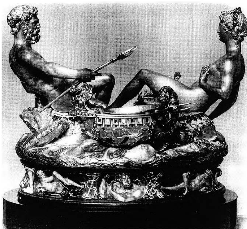
Figure 2. Benvenuto Cellini, Salière de François I er, 1539-43, or et émail, Vienne, Kunsthistorisches Museum.

de prison de Cellini et dont le récit sert de déclaration d'indépendance de l'artiste en ce qui concerne ses conceptions iconographiques. Deux humanistes, en présence du cardinal de Ferrare, s'affrontent en opposant leurs descriptions de l'œuvre à accomplir avant de s'en remettre au jugement de l'artiste. L'un est la grâce et la beauté personnifiées, l'autre n'est que laideur et difformité. Leurs discours reflètent leurs traits, mais ni l'un ni l'autre ne produit pour Cellini une description qui mérite traduction en termes plastiques. Quand on lui demande de choisir entre leurs « esquisses en paroles », entre d'un côté Vénus avec Cupidon, et de l'autre l'épouse de Neptune entourée de Tritons, hommes-poissons, Cellini déclare qu'il leur préfère un de ses « propres fils », comme celui qu'il va leur montrer, fruit de ses propres mains et produit de son invention 23 . Se tournant vers les deux éminents lettrés, il ajoute : « Vous avez parlé, moi je réaliserai » 24 . Sa proposition n'est pas « une esquisse en paroles », ni une esquisse de sa main, c'est déjà un objet réalisé, une petite sculpture en cire qui servira de modello pour l'œuvre en or et en émail qui se trouve maintenant au Kunsthistorisches Museum de Vienne.