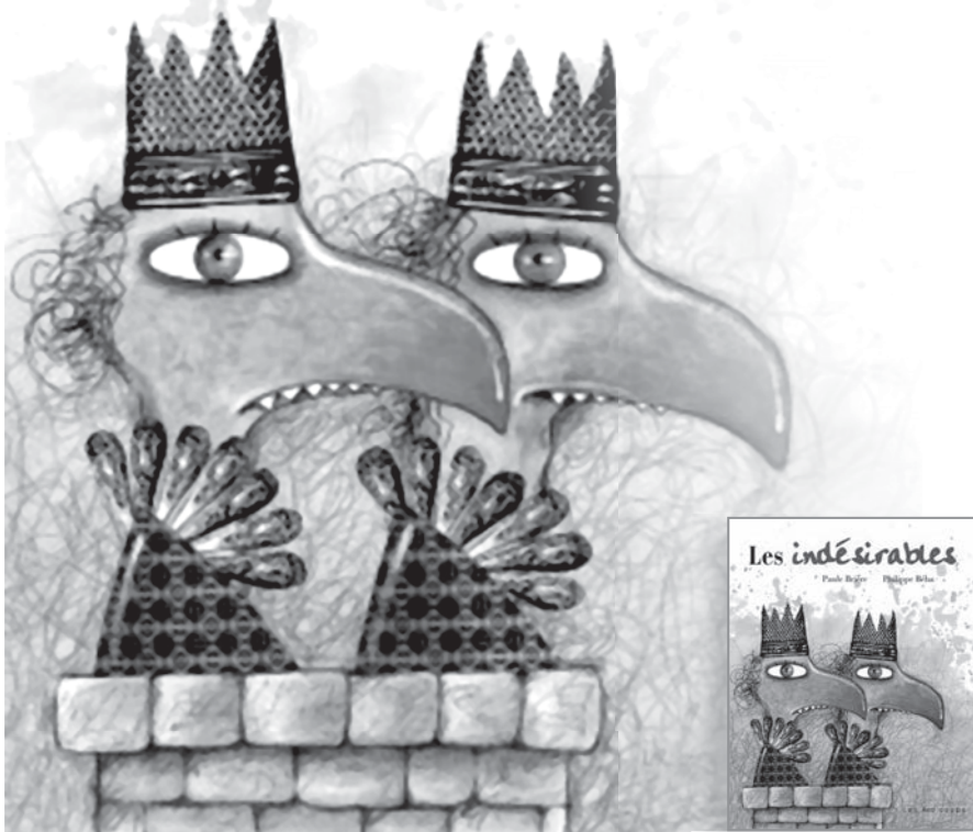
Illustration : Philippe Béha (Les indésirables)

L es différences !... Elles sont nombreuses dans une classe. Un élève vient d'un autre pays, un autre est roux, une élève a un trait physique particulier... Comment aborder le sujet avec les élèves de tous les cycles ? Comment aborde-t-on la discrimination, le rejet en raison des différences et la peur qu'elles suscitent et qui mènent à la violence ?