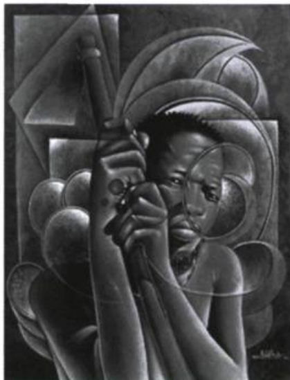
Jean-Michel Basquiat, Négritude .

Christian est une passerelle entre la mémoire et l'oubli, et il permet à la protagoniste de faire la paix avec son passé, elle qui en début de récit se moque de l'attachement à la filiation qui est cher à son peuple :