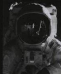
PREMIER HOMME SUR LA LUNE