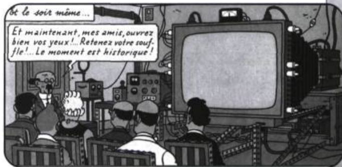
Hergé, Les bijoux de la Castafiore , Casterman, 1963.