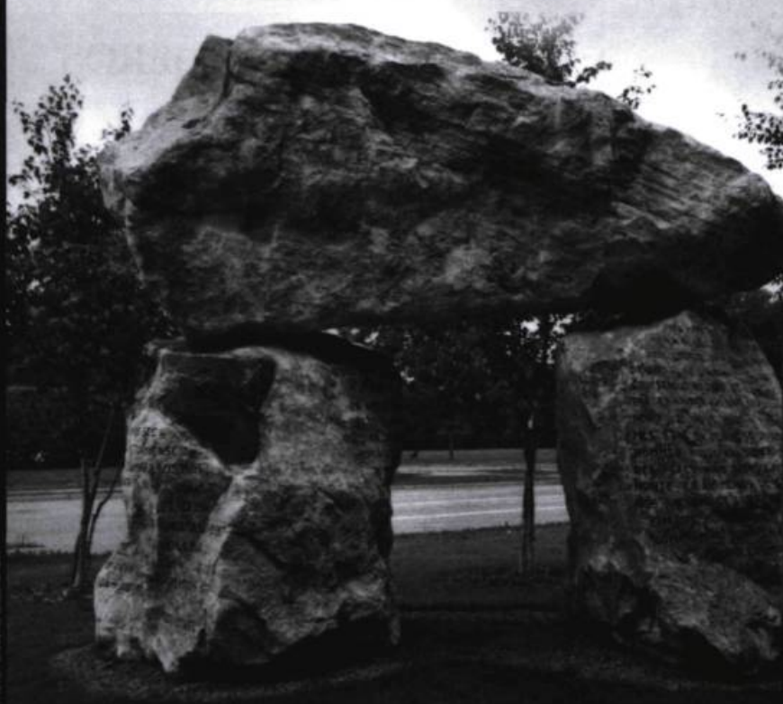
Armand Vaillancourt, Drapeau blanc , Université Laval, Sainte-Foy, 1987.