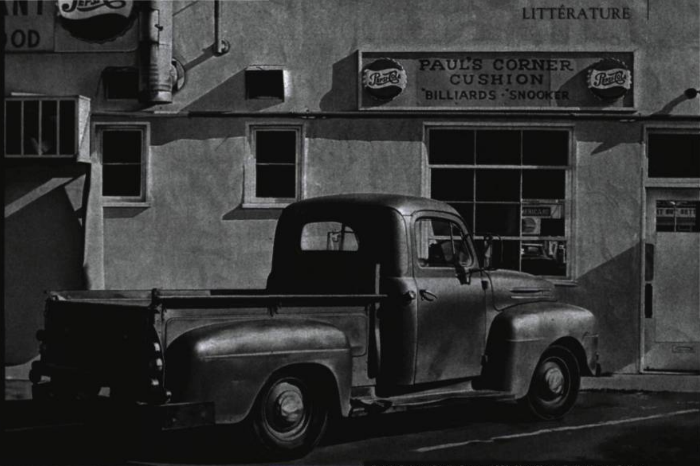
Ralph Goings. Paul's Corner , 1970, New York, O. K. Harris Gallery