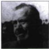
JACK KEROUAC JOHN STEINBECK