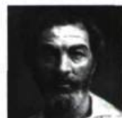
MARK TWAIN WALT WHITMAN