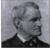
FENIMORE COOPER FRANCIS PARKMAN