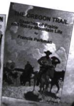
Le guide Henry Châtillon. Illustration de Frederic Remington (1861-1909) pour l'édition de luxe des œuvres de Parkman éditée en 1899 par George N. Morang & Company.