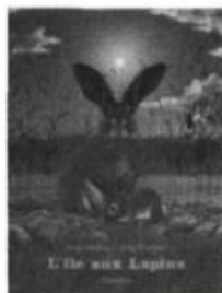
Les Albums Duculot