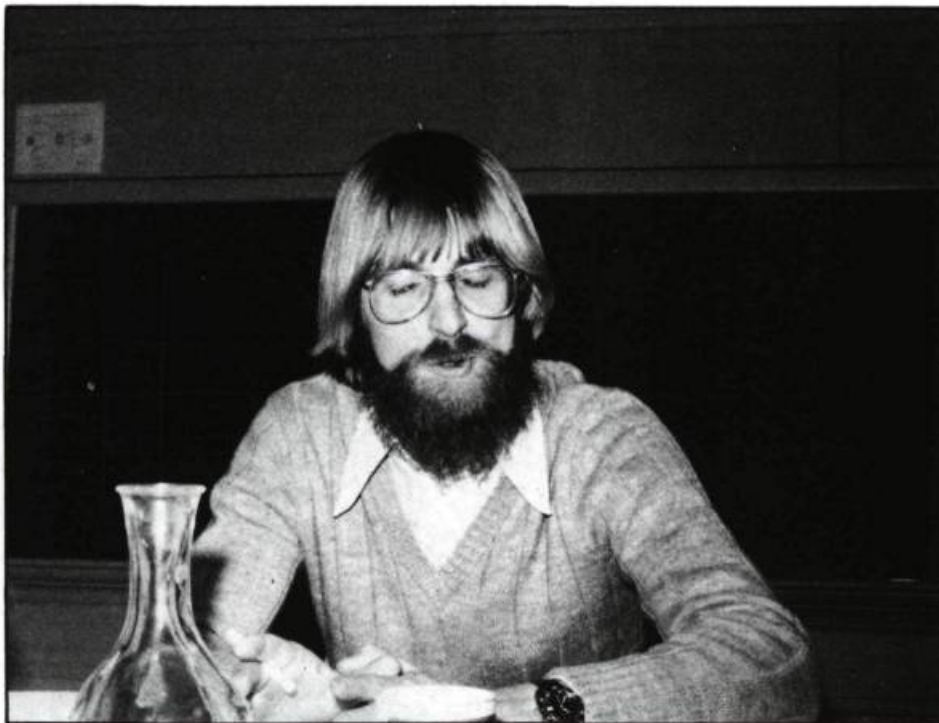
Ce n'est pas en faisant 300 millions d'exercices...

P. C.: Le programme est axé sur un modèle d'apprentissage et non sur un modèle d'éducation ou un type d'école. Le programme ne se veut pas un nouveau mouvement dans le sens que l'on a fait la synthèse des différents renouvelés pédagogiques qui étaient conciliables.