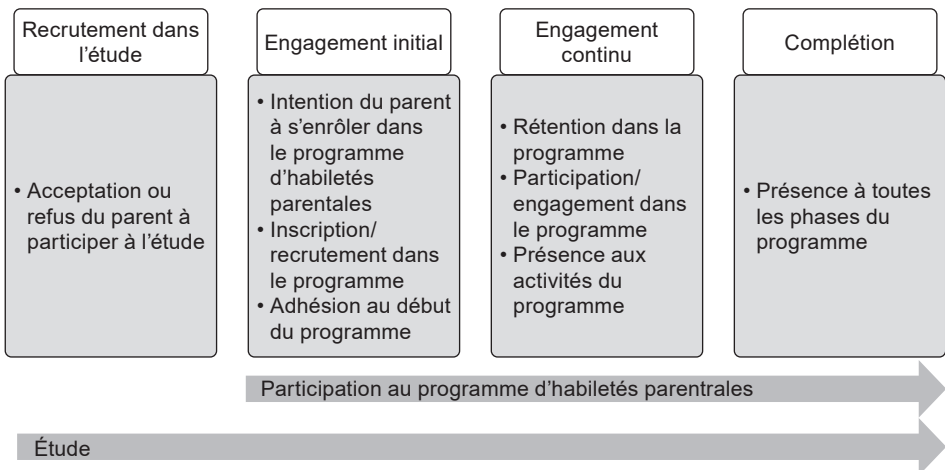
Figure 1. Modèle de participation parentale