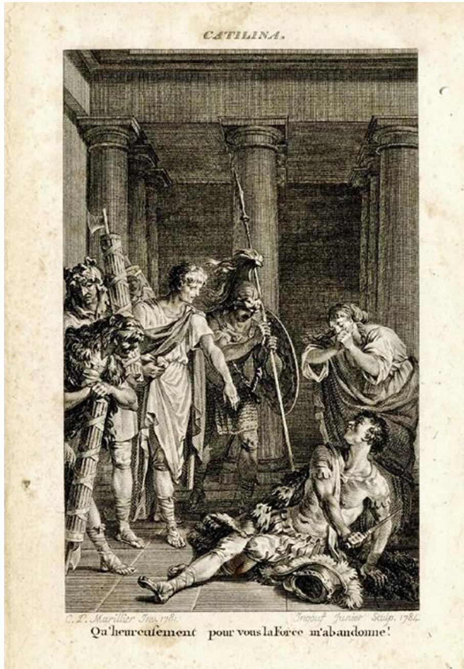
Gravure sur cuivre représentant la scène finale de Catilina . 1785.