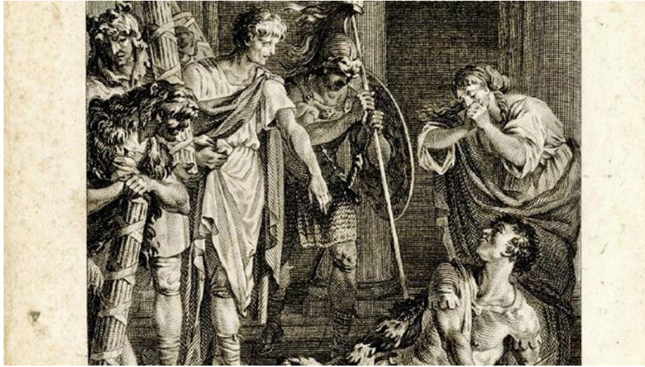
Gravure sur cuivre représentant la scène finale de Catilina . 1785.