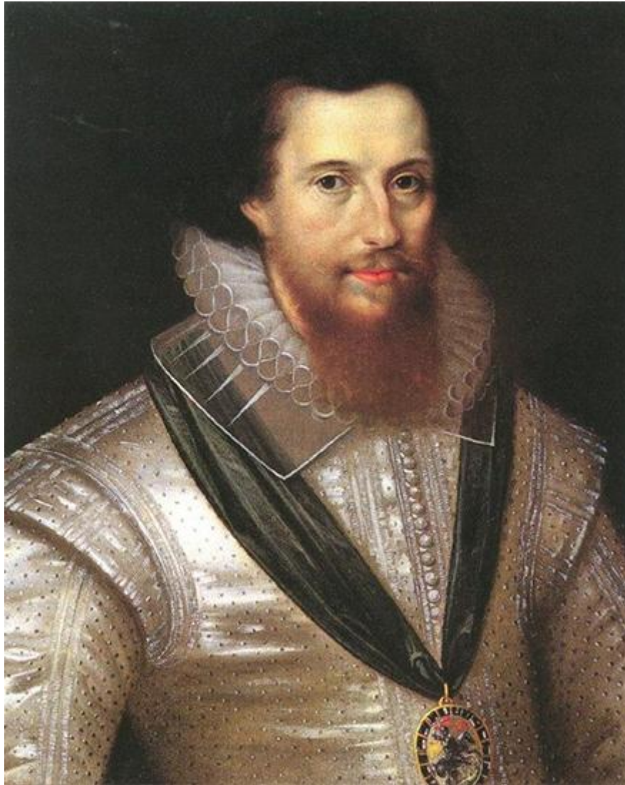
Portrait du Comte d'Essex (Robert Devereux). 1596.

Huile sur toile d'après Marcus Gheeraerts Le Jeune.