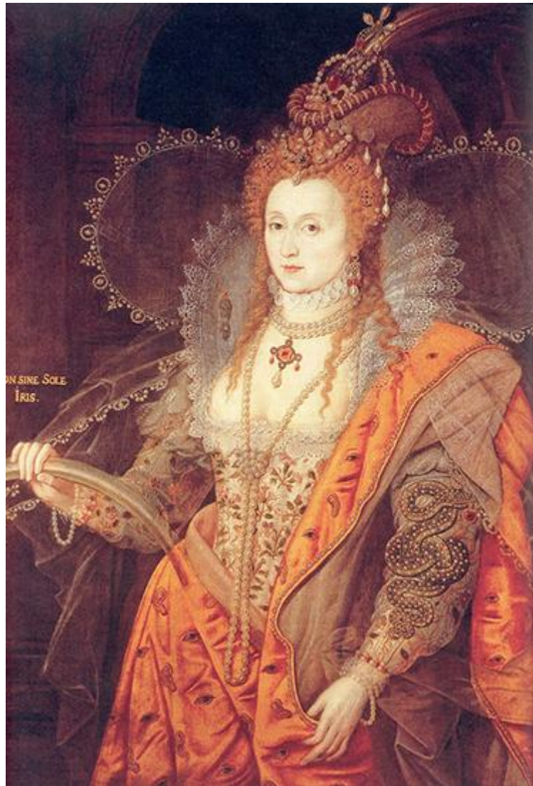
Le « portrait arc-en-ciel » d'Élisabeth I ère ; une représentation allégorique de la reine toujours jeune malgré sa vieillesse. Vers 1600.