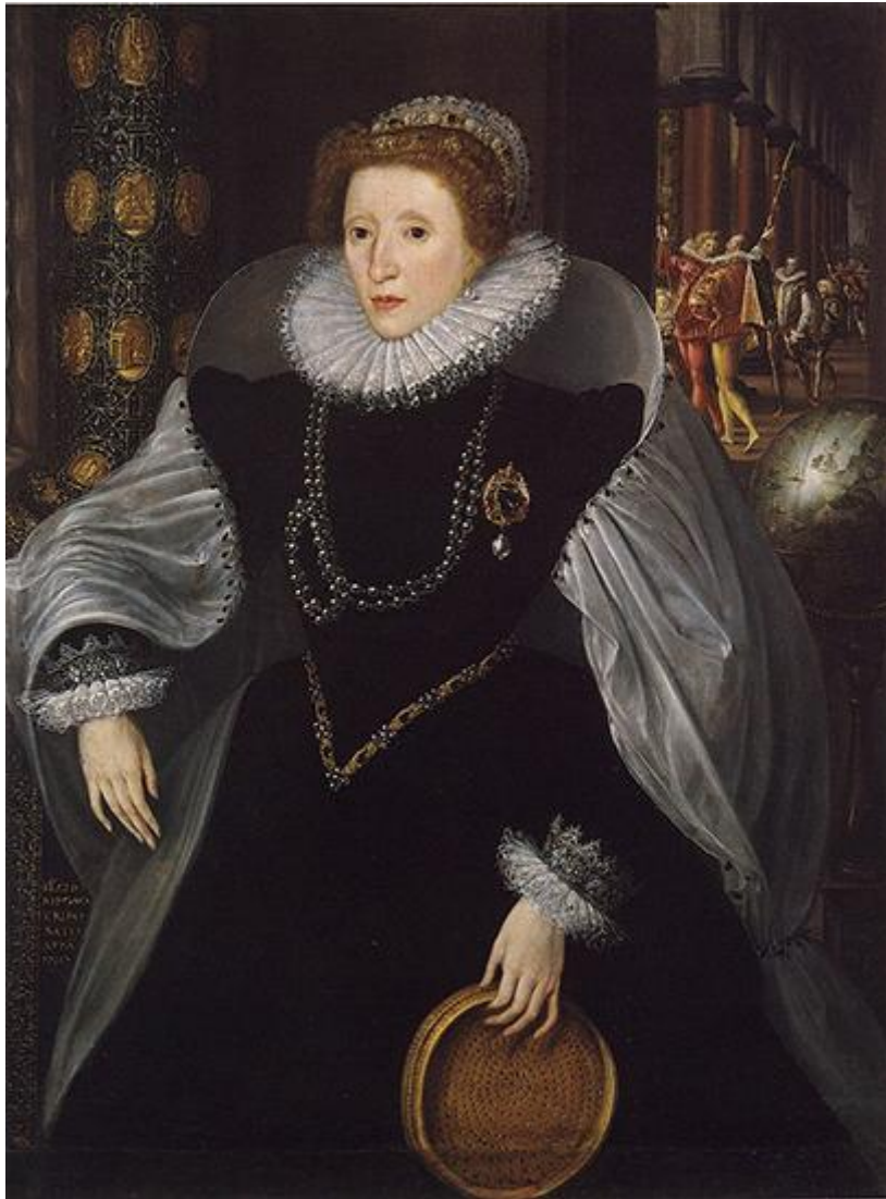
Portrait d'Élisabeth I ère . Vers 1583.