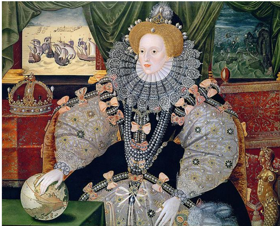
Portrait d'Élisabeth I ère commémorant la défaite de l'invincible Armada.

Portrait anciennement attribué à George Gower.