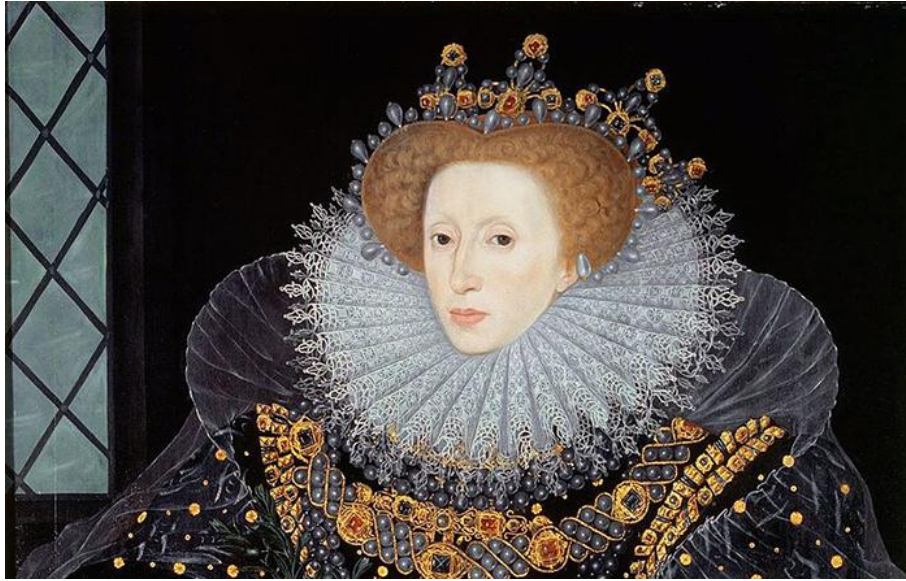
Portrait de la reine Élisabeth. 1585.