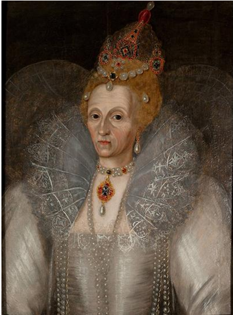
Portrait de la reine Élisabeth. Vers 1595.

Portrait attribué à Marcus Gheeraerts Le Jeune.