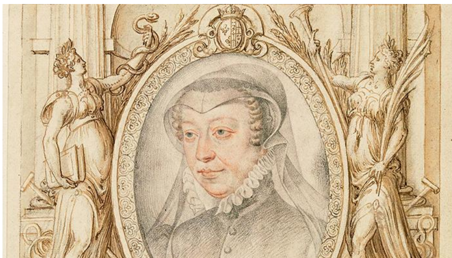
Portrait de Catherine de Médicis.

Bibliothèque nationale de France. Portrait attribué à François Clouet.