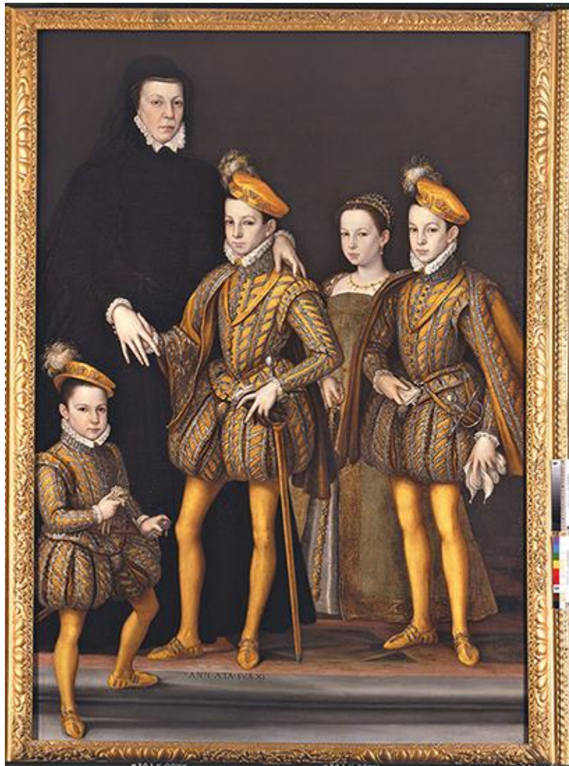
Portrait de Catherine de Médicis et de ses enfants. Accepté en guise d'impôt de succession par le gouvernement britannique et attribué à Strawberry Hill.