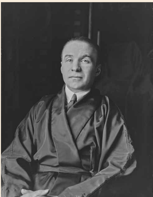
Francis de Miomandre