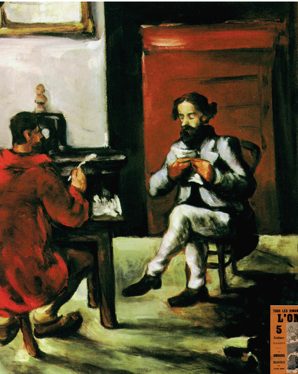
Paul Cézanne, Une lecture de Paul Alexis chez Zola (1869-1870)

accompagnent les envois des premiers textes sortis de leur plume. Intérêt anecdotique pour le lecteur d'aujourd'hui mais aussi des surprises : tous deux manifestent une infatigable facilité à versifier, par milliers des vers de mirilton parmi des morceaux poétiques inspirés par leur commune admiration pour Musset. Imagine-t-on Zola poète, et Cézanne aussi ? Déjà, une confiance jamais démentie dans le talent et l'avenir de l'autre, des encouragements à persévérer, et tous les deux en auront grand besoin ! Cézanne est sensible à