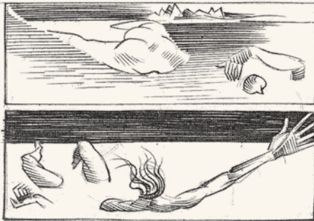
Gravures d'Albert Flocon.

laisse place à un être qui lui est supérieur moralement, c'est-à-dire d'une « bonté », au sens défini par Kant, qui nous échappe depuis la nuit des temps.