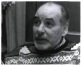
Tahar Ben Jelloun