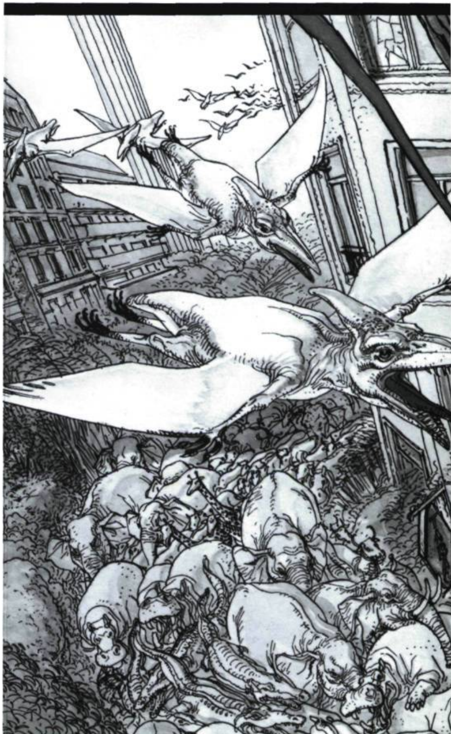
Les pionniers de l'aventure humaine par Boucq

Comment se fait-il que la mention toponymique en vienne à saturer le texte? Il y a de toute évidence un plaisir immense à nommer les lieux de tous les jours; Jean-François Chassay note le fondement ludique de l'énumération qui permet de tracer un parcours culturel et de se situer dans l'Histoire. À cet effet, ne serions-nous que des nouveaux riches de la culture? Le rattrapage onomastique n'aurait-il pour but que de proposer ▶