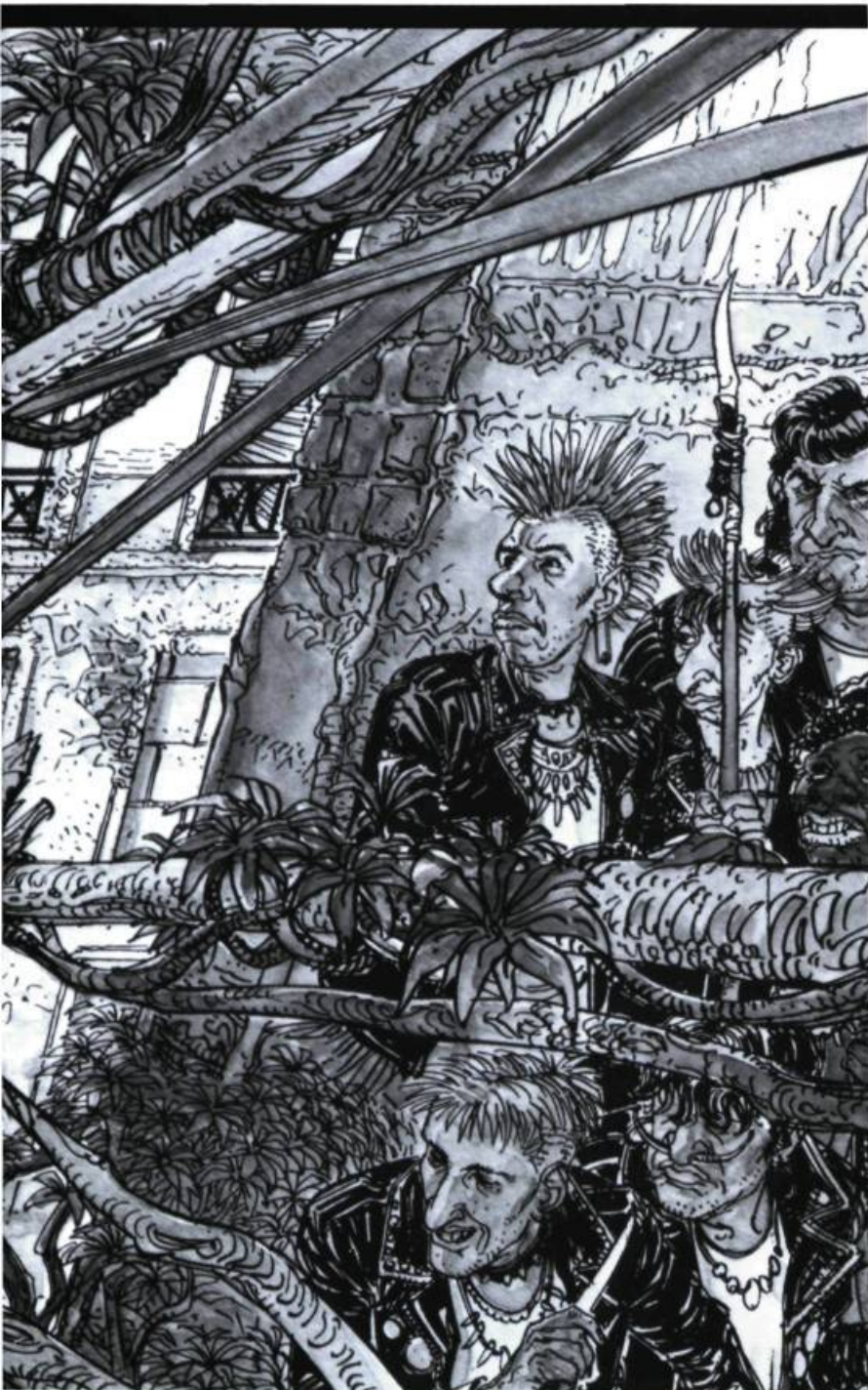
Les pionniers de l'aventure humaine par Boucq