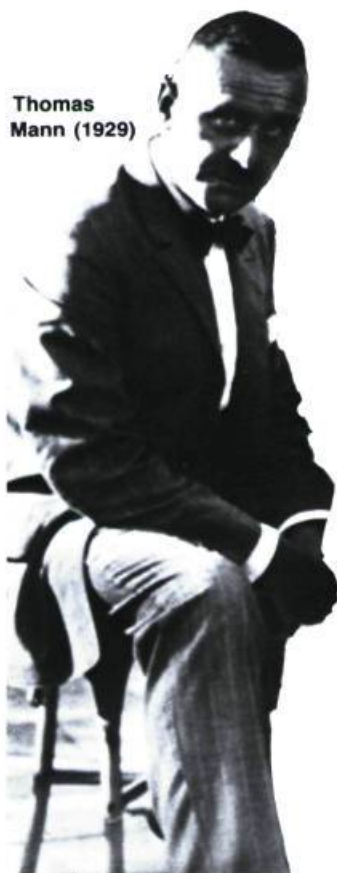
Thomas Mann (1929)