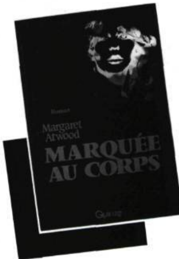
MARQUÉE AU CORPS Margaret Atwood Quinze, 1983

Avant sa terrible opération, Rennie mène une existence insouciant et confortable. Journaliste de mode, membre du jet-set torontois, elle vit, comme la majorité de ses contemporains dans la trentaine, un amour du genre désintéressé. Voilà qu'un cancer du sein bouleverse sa vie: elle quitte son concubin, laisse tomber les visites d'usage au médecin et part quelques jours dans une île des Caraïbes.