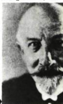
Georges Méliès, 1928

Mais à part quelques pionniers géniaux comme Méliès (qui réalisa plus de 500 films entre 1896 et 1913 et inventa la plupart des trucages du cinéma) et Zecca, on manquait alors de bons scénaristes, et même de scénaristes tout court. Le cinéma étant une forme d'expression nouvelle, à peu près personne ne savait trop bien comment écrire pour