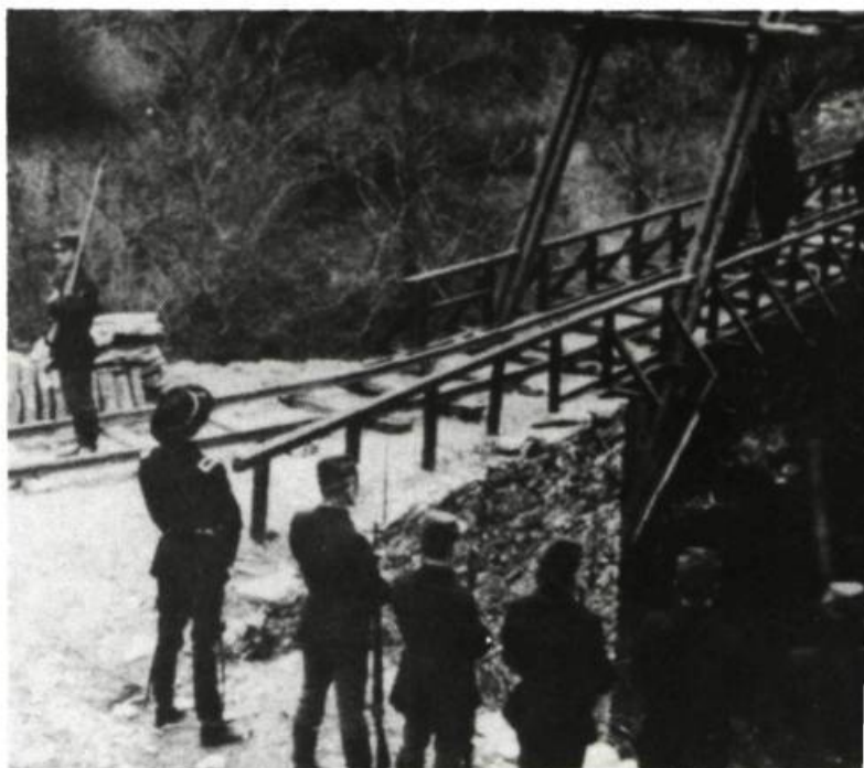
La rivière du hibou, 1961

L'adaptation libre. Elle demande une fidélité moindre au texte original. On y trouvera non seulement les changements que l'on rencontre dans l'adaptation stricte, mais également un certain nombre de transformations, d'additions ou de retraites qui sont du cru même de l'adaptateur. Il y a cependant une limite: on ne doit changer ni le sens général, ni la portée ou la structure dramatique fondamentale de l'œuvre originale.