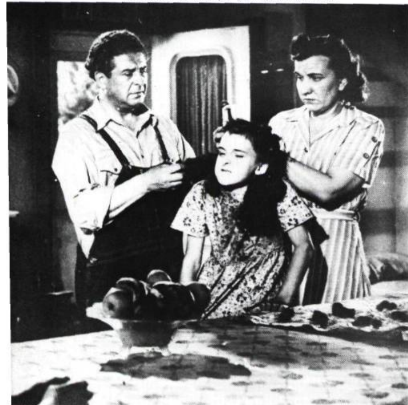
Aurore, l'enfant martyr Cinémathèque québécoise

lui. L'adaptation permit donc en premier lieu de pallier quelque peu à cette carence en offrant aux cinéastes des récits bien construits, originaux et intéressants.