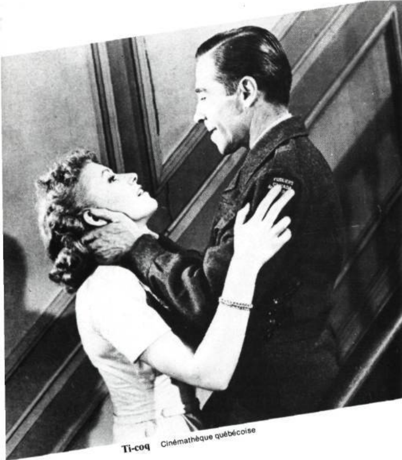
Ti-coq Cinémathèque québécoise