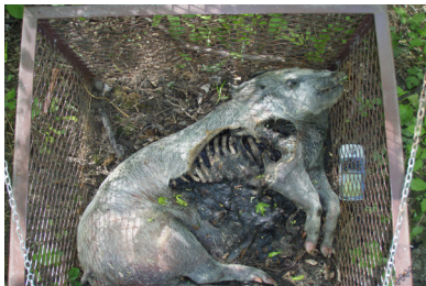
i) jour 195 (14 mai 2013)