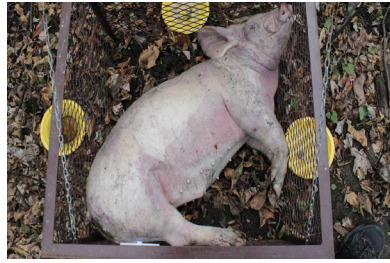
b) jour 5 (5 novembre 2012)