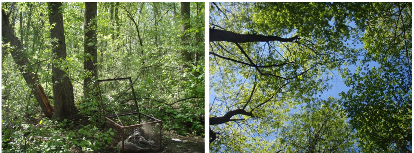
Figure 2. Photos de la cage de fer, du milieu environnant et de l'ouverture de la canopée.