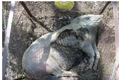
h) jour 186 (5 mai 2013)