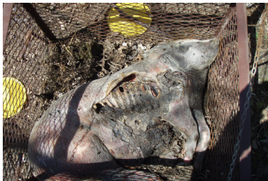
g) jour 179 (28 avril 2013)