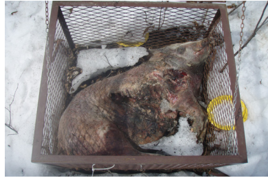
d) jour 151 (31 mars 2013)