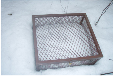
c) jour 130 (10 mars 2013)