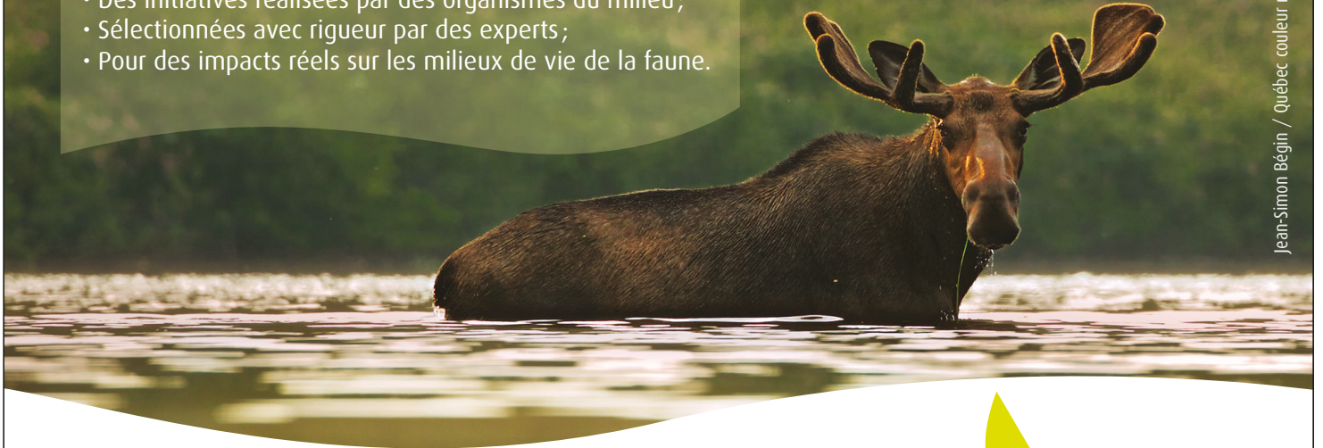
Jean-Simon Bégin / Québec couleur nature