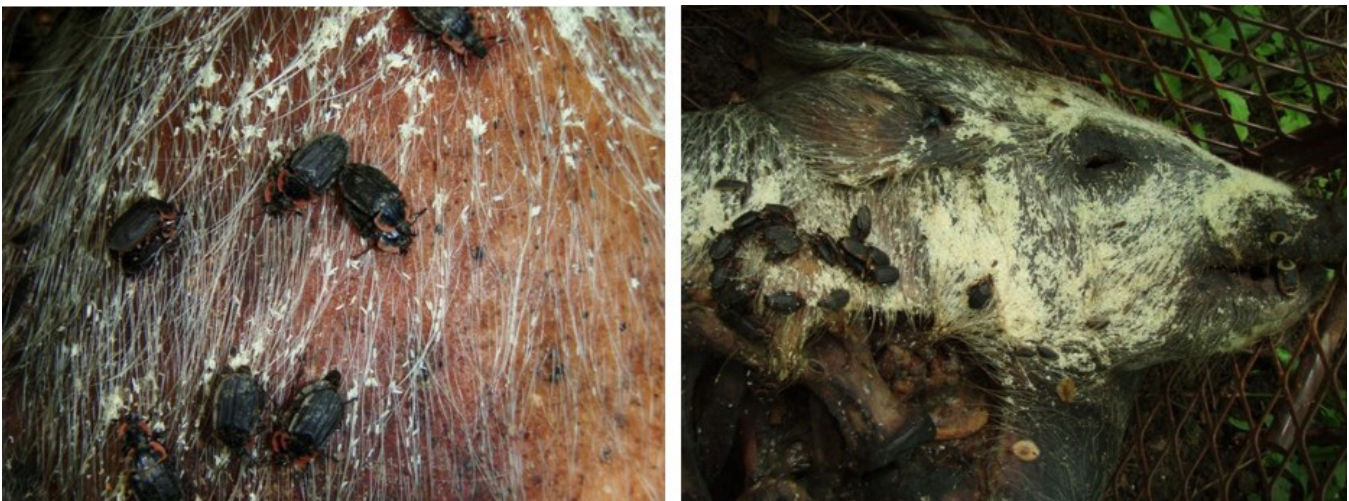
Figure 5. Au jour 209 (28 mai 2013), les adultes du silphe marginé Oiceoptoma noveboracense (Foster) s'alimentent et s'accouplent sur la carcasse. La tête du porcelet est couverte d'une deuxième vague d'asticots.

Cette étude préliminaire, bien que qualitative et anecdotique, contribue à documenter la décomposition hivernale des carcasses de mammifères au Canada et la succession des insectes nécrophages. De plus, elle constitue une ressource pour la création d'une collection de référence sur les insectes nécrophages et d'importance judiciaire au Québec. Nous étions limités en ayant une seule carcasse et un seul hiver de collecte. Cependant, nos résultats, tout comme ceux d'Anton et collab. (2011), montrent que les stades de décomposition et la succession des communautés d'insectes