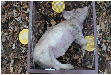
a) jour 0 (31 octobre 2012)