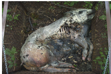
j) jour 209 (28 mai 2013)