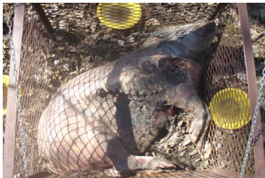
e) jour 157 (6 avril 2013)