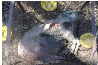
f) jour 172 (21 avril 2013)