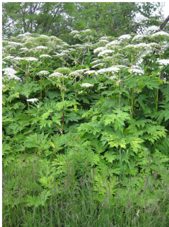
Isabelle Simard, MDDELCC

Source : http://plantesenvahissantes.org