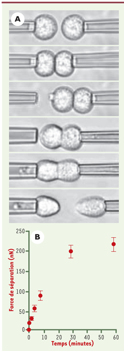
Figure 1. Méthode de mesure de la force de séparation. A. De haut en bas et de droite à gauche: les cellules exprimant la \epsilon -cadhérine sont mises en contact et forment un doublet adhésif ensuite maintenu sous forte aspiration par la pipette de droite. Des étapes successives d'augmentation de l'aspiration dans la pipette de gauche et d'écartement des pipettes sont effectuées jusqu'à l'obtention de la séparation du doublet. Connaissant l'aspiration appliquée à gauche au moment de la séparation et le rayon interne de la pipette, il est possible de calculer la force de séparation. B. La force (exprimée en nanoNewton) nécessaire pour séparer des cellules est fonction de la durée du contact entre cellules (d'après [8]).

cellulaire. En effet, en présence de réactifs inhibant la polymérisation de l'actine ou bien en remplaçant des cadhérines sauvages par des cadhérines mutées, déléetées des sites de liaison aux connecteurs cytoplasmiques de l'actine (Figure 2C), il y a déclenchement de l'adhérence entre cellules, mais celle-ci