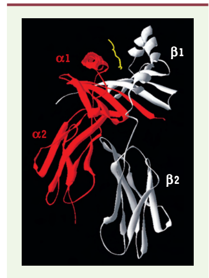
Figure 1. Structure tridimensionnelle de la molécule soluble HLA-DR1 liée à un peptide issu du virus influenza. La chaîne \alpha (rouge) et la chaîne \beta (blanche) interagissent avec le peptide antigénique (jaune). Les domaines \alpha 1 et \beta 1 forment la niche peptidique tandis que les régions \alpha 2/\beta 2 sont ancrées à la membrane par des régions hydrophobes qui sont exclues des formes solubles représentées ici [10].

Cela permettrait d'éviter l'activation aléatoire de lymphocytes B potentiellement auto-réactifs [4]. HLA-DO apparaît donc comme un régulateur naturel de la présentation antigénique. Bien que sa fonction précise demeure inconnue, son rôle inhibiteur de la présentation antigénique laisse présumer qu'une meilleure connaissance de son mode d'action et de sa structure pourrait permettre d'améliorer l'efficacité des vaccins ou encore de combattre les maladies auto-immunes.