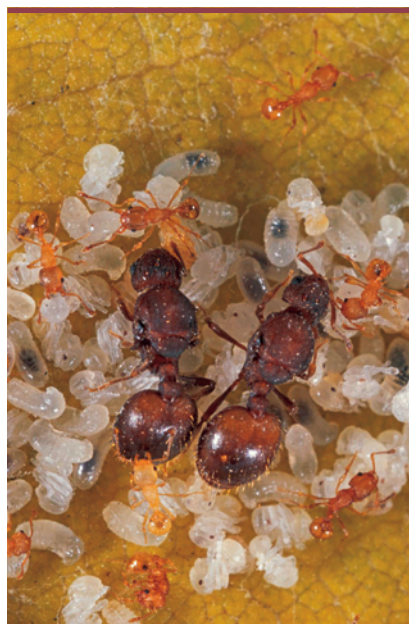
Figure 1. Wasmannia auropunctata : reines, ouvrières et larves.

Les génotypes des ouvrières comporte à chaque locus analysé un des deux allèles portés par les reines, mais également un allèle nouveau. En disséquant la spermathèque des reines (réceptacle où sont stockés les spermatozoïdes après que la