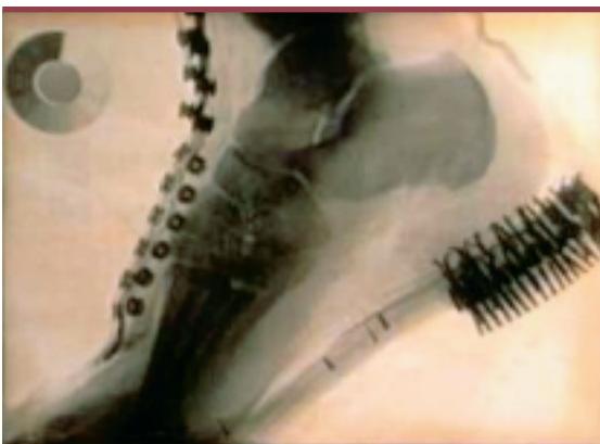
Figure 1. Radiographie d'un pied recouvert de sa chaussure prise à l'aide du « skiascope », appareil à rayons X inventé en 1896 par Mgr Clovis Laflamme, professeur de physique et Recteur de l'Université Laval.

Il y décrit notamment les cellules sympathicotropes dites « cellules de Berger » ( Figure 2 ). Un Institut de biologie et un Institut du cancer furent également créés. Un Service de diététique vit le jour et les écoles d'infirmières de plusieurs hôpitaux furent affiliées à la Faculté. En 1929, l' American Medical Association