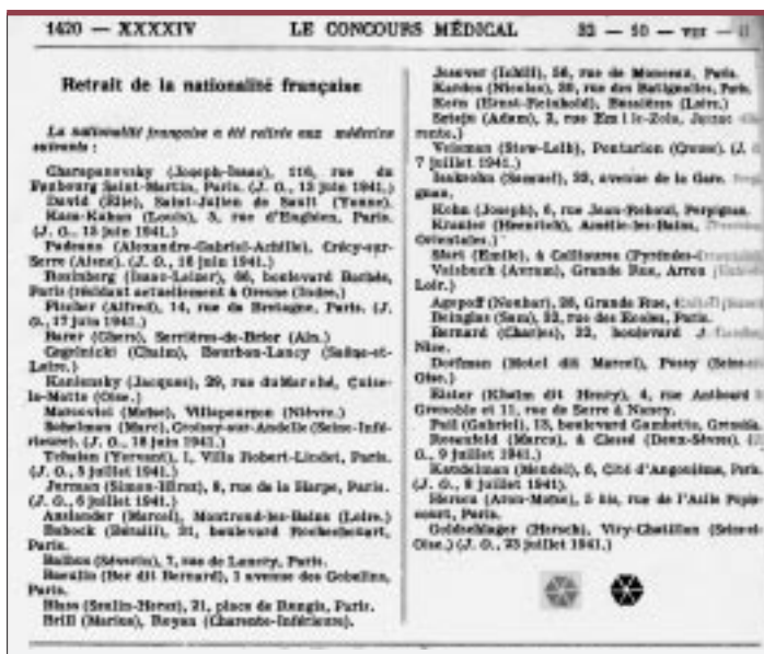
Le Concours Médical , 10 août 1941.

de langage, de sensibilité » et que la loi avait surtout pour objectif d'éliminer une catégorie de médecins étrangers « que nous nous accordons tous à répudier, les circonstances nous en donnent l'occasion; chassons les tard-venus, les non-assimilés, les volées de rapaces qui trop longtemps pillèrent notre grain » [21]. Dans un article intitulé « Où allons-nous? » [22] paru un an après la promulgation de la loi du 16 août 1940, R. Massard expliquait les conséquences sur le corps médical et il manifestait sa satisfaction devant la mise en place de la politique d'exclusion des médecins juifs étrangers: « En exigeant du médecin, pour exercer en France, l'obtention d'être français d'origine, le régime nouveau a apporté aux médecins français un avantage qu'ils réclamaient vainement depuis la Grande Guerre. Nous ne verrons plus ces confrères bizarres, parlant à peine notre langue, qui mettaient les clientèles en coupe réglée, ignoraient la bienséance et la déontologie et avaient envahi la France, en nombre illimité. En réservant notre accueil aux seuls étrangers qui, par leur mérite, leur valeur ou leur courage, se sont élevés au-