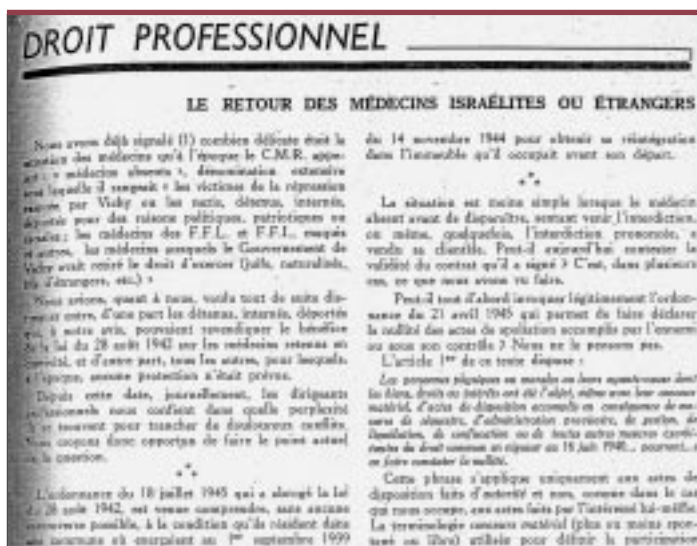
Le Concours Médical , 20 septembre 1945.

Analysis of a well-known medical journal, the Concours Médical reveals the attitude among the French medical corps between 1940 and 1944. This journal kept its readers informed of the various stages of xenophobia and anti-Semitism under the Vichy government. It provided the decisions adopted, and the application of measures prohibiting foreign and Jewish physicians to practice, regularly publishing lists. Analysis of the editions published under the occupation clearly shows the xenophobia and anti-Semitism that existed among a certain population of French practitioners. ♦