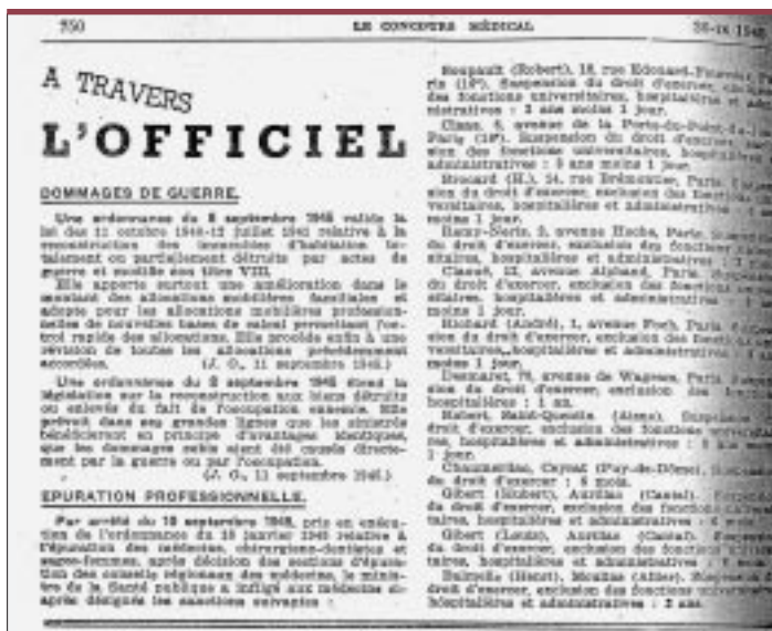
Le Concours Médical, 30 septembre 1945.