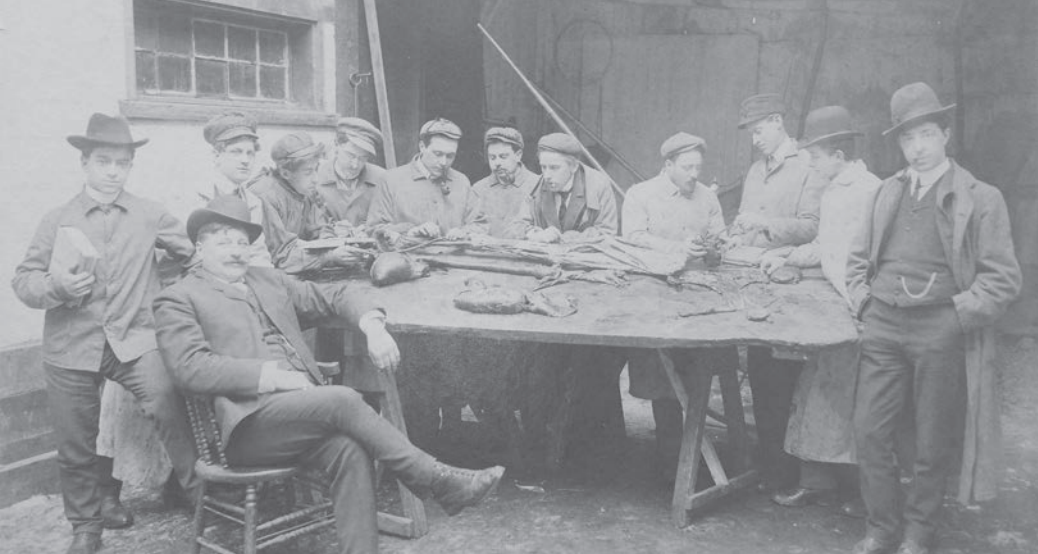
Classe d'anatomie avec le D r François-Théodule Daubigny (assis), entouré de ses élèves, à l'École de médecine comparée et de science vétérinaire de Montréal, 1902.